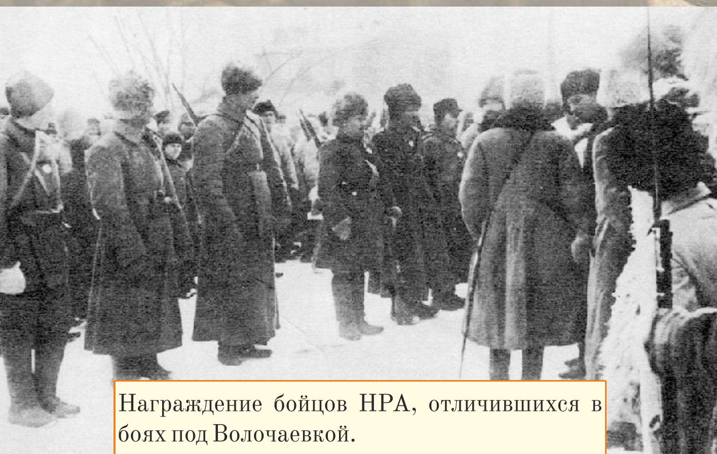
Награждение бойцов НРА, отличившихся в боях под Волочаевкой.