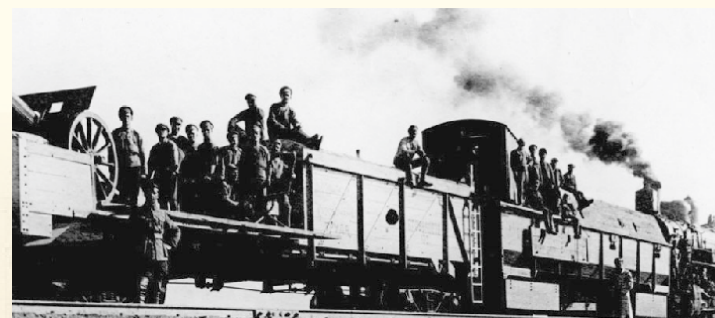
Бронепоезд № 8 НРА, 22 февраля 1922 г. С этого бронепоезда 12 февраля был дан сигнал — 3 выстрела — к финальному штурму Волочаевки.