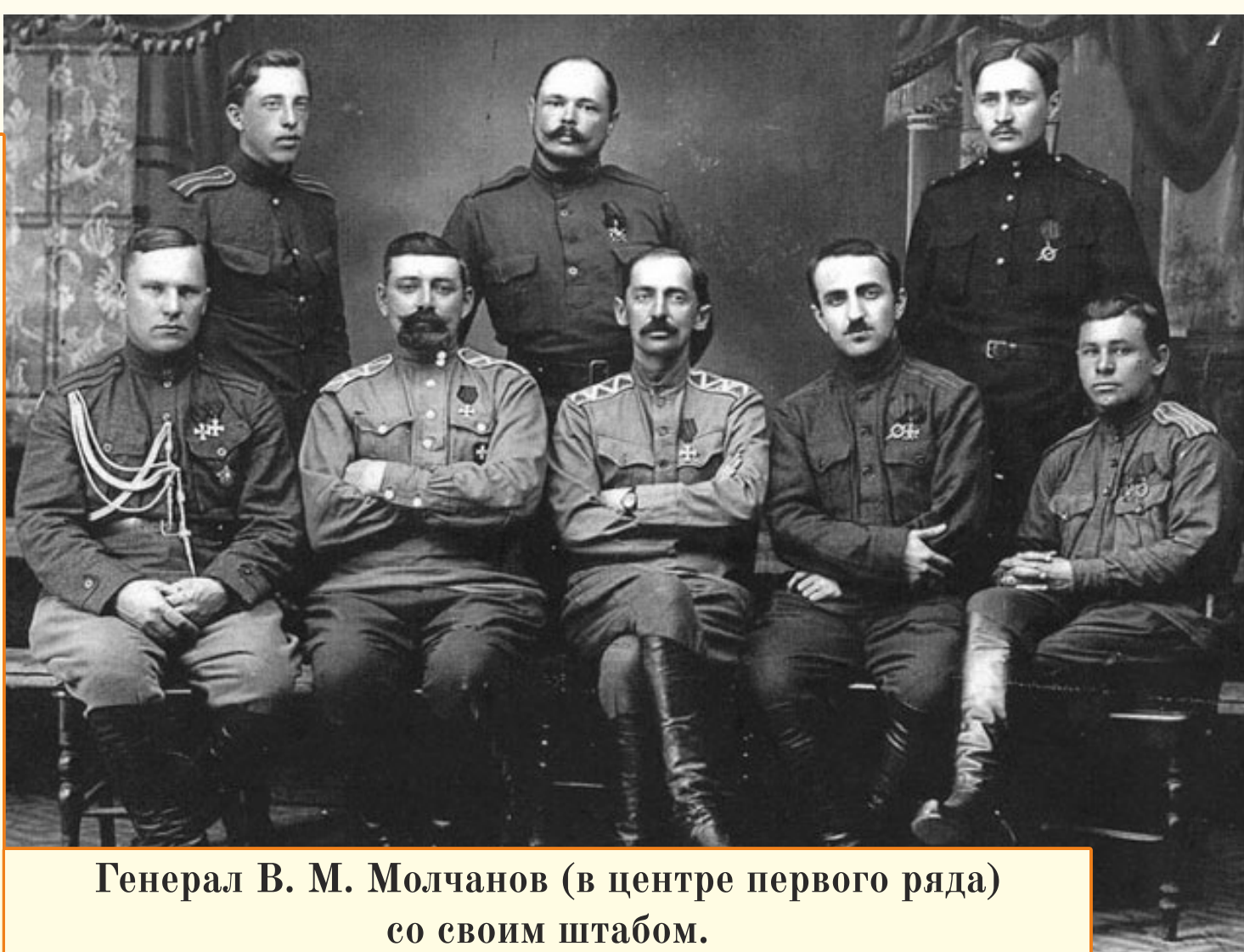
Генерал В. М. Молчанов (в центре первого ряда) со своим штабом.

Белоовстанческая армия Командующий: В. М. Молчанов 3850 штыков 1100 сабель 62 пулемета 13 орудий 3 бронепоезда Потери: 1100 человек: до 400 убитых, свыше 700 раненых.