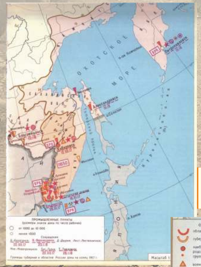
Карта установления Советской власти на Дальнем Востоке в 1917-1918 гг. (фрагмент)