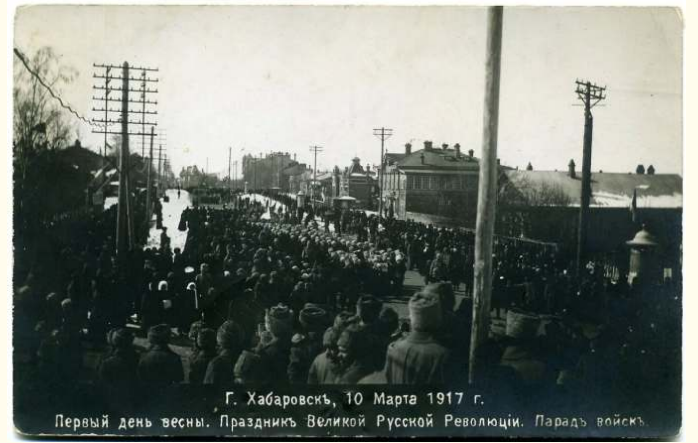
Г. Хабаровск, 10 Марта 1917 г. Первый день весны. Праздник Великой Русской Революции. Парад войск