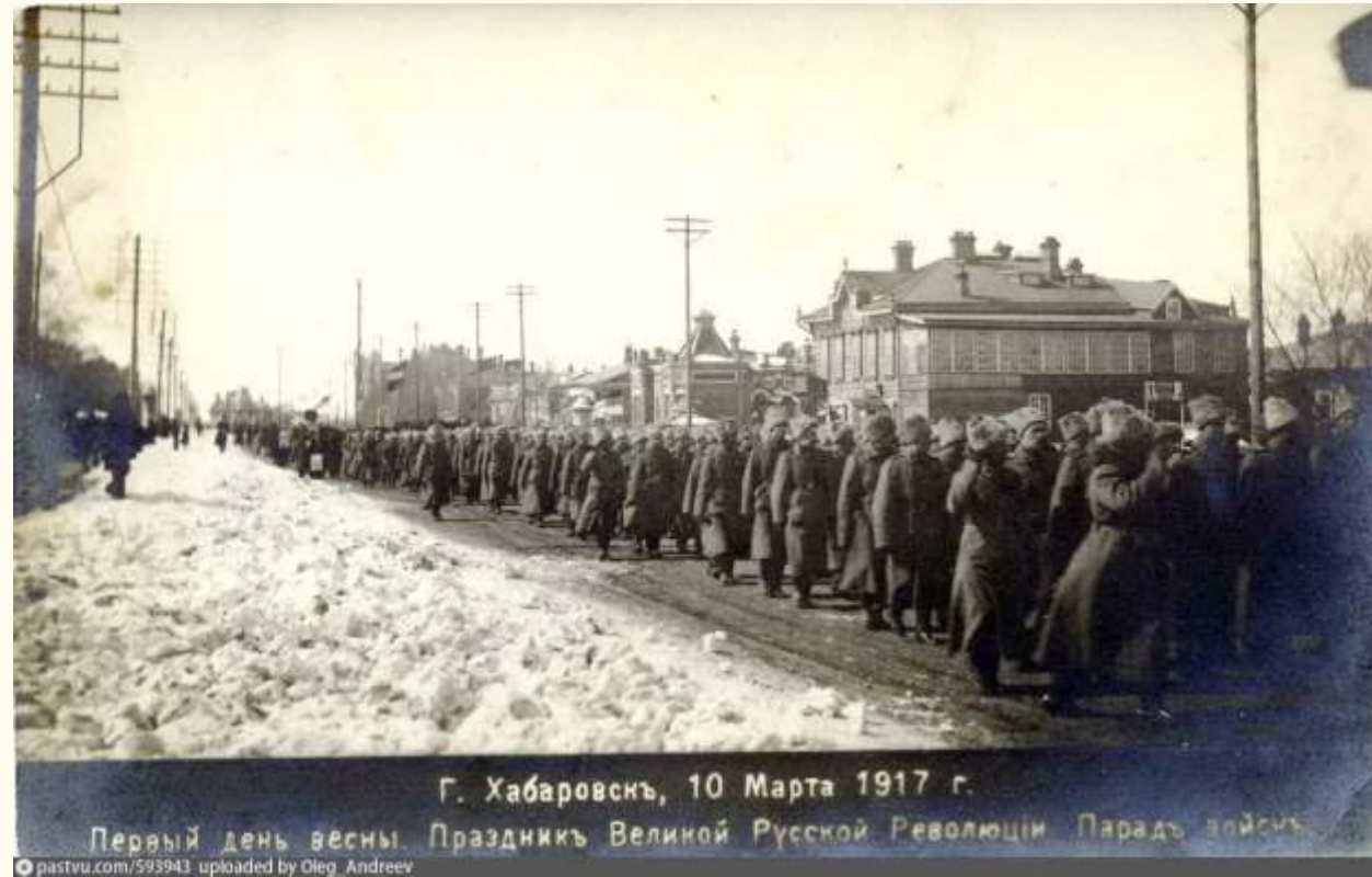
Г. Хабаровск, 10 Марта 1917 г. Первый день весны. Праздник Великой Русской Революции. Парад войск

25(12) декабря. Хабаровск. Открылся Третий ДВ краевой съезд советов Р., С. и Кр. депутатов при наличии 84 делегатов, из них: большевиков — 46, левых эсеров — 27, меньшевиков — 9 и беспартийных — 2.