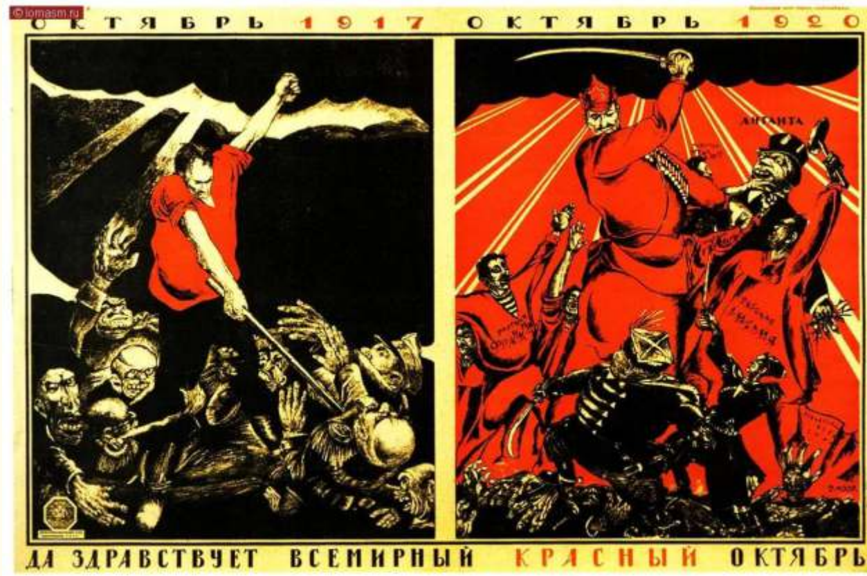
ДА ЗДРАВСТВУЕТ ВСЕМИРНЫЙ КРАСНЫЙ ОКТЯБРЬ

2-й съезд советов Дальнего Востока. 16-25 (3-12) августа. Хабаровск. Открылся Второй Дальневосточный съезд С. Р. и С. Д. На съезде присутствовало 86 делегатов, в том числе 13 большевиков, 32 эсера, 25 меньшевиков. Повестка дня: 1) Доклады с мест; 2) Доклад о деятельности краевого исполкома советов; 3) Об отношении к Врем. пр-ву и войне; 4) О будущем советов после созыва Учред. собр. и ряд других вопросов. При обсуждении вопроса об отношении к Времен. пр-ву фракция большевиков внесла резолюцию, разоблачавшую буржуазную сущность Врем. пр-ва и требовавшую взятия всей власти советами. Обнаружились глубокие принципиальные разногласия, и съезд раскололся на 2 крыла: революционное, представленное большевиками, и контрреволюционное — эсеро-меньшевистское. Благодаря количественному перевесу на съезде делегатов мелкобуржуазных партий, все решения приняты в эсеро-меньшевистском духе. «Дальрх., прот. 2 съезда, ф. 731.