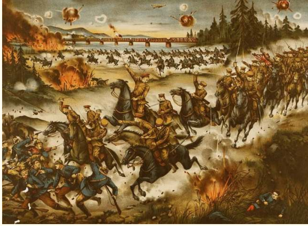
Японские агитационные плакаты о захвате Хабаровска

Выступление, или вернее нападение, японских войск произошло в понедельник 5 апреля. Было около 10 часов утра, население Хабаровска приступило к обычному мирному труду. Магазины и базар были открыты; на улицах шло обычное движение пешеходов, автомобилей, извозчиков. Словом, всюду кипела мирная трудовая жизнь, и никому в голову не приходило, что вот-вот загрохочут орудия и польется человеческая кровь.