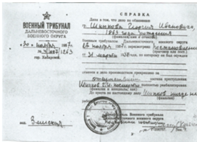
Справка Военного трибунала Дальневосточного военного округа.