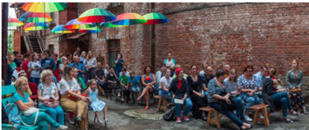
Мероприятие проекта «Библиодвор». ДВГНБ, исторический двор основного здания, 27 июля 2019 года.