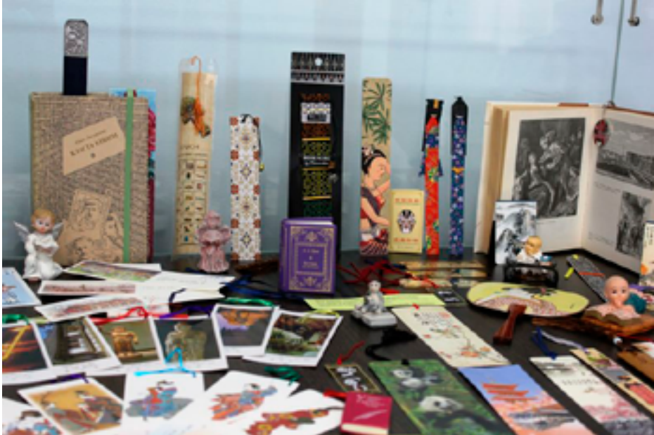
Выставка коллекционных книжных закладок, приуроченная ко Дню воспоминания любимых книжек. ДВГНБ, ХРЦПБ, июль 2019 года.