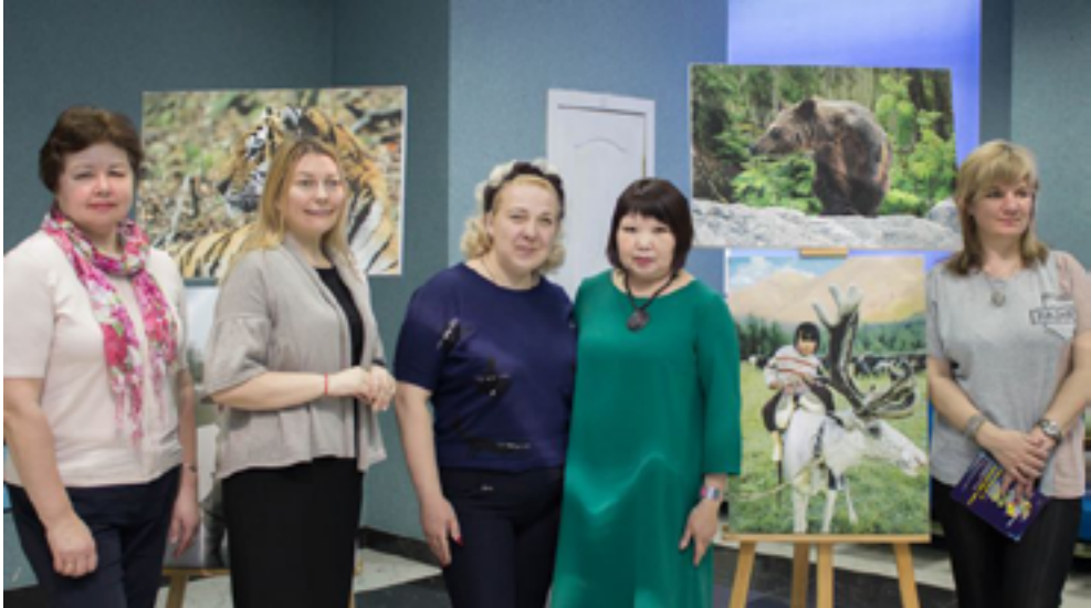
Организаторы и участники информационно-просветительского проекта «Знай и люби свой край». Село Князе-Волконское, 30 апреля 2019 года.