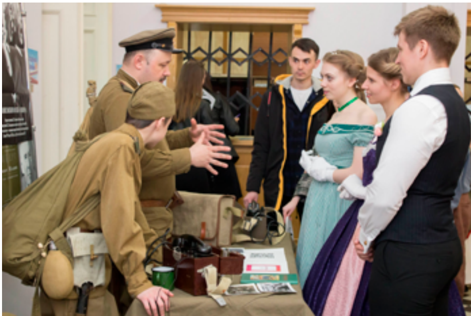
Участники Всероссийской акции «Библионочь-2019». ДВГНБ, 21–22 апреля 2019 года.