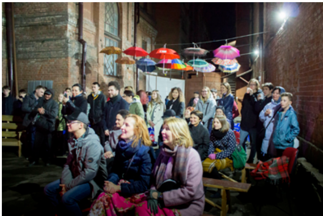
Всероссийская акция «Библионочь-2019». ДВГНБ, исторический двор основного здания библиотеки, 21–22 апреля 2019 года.