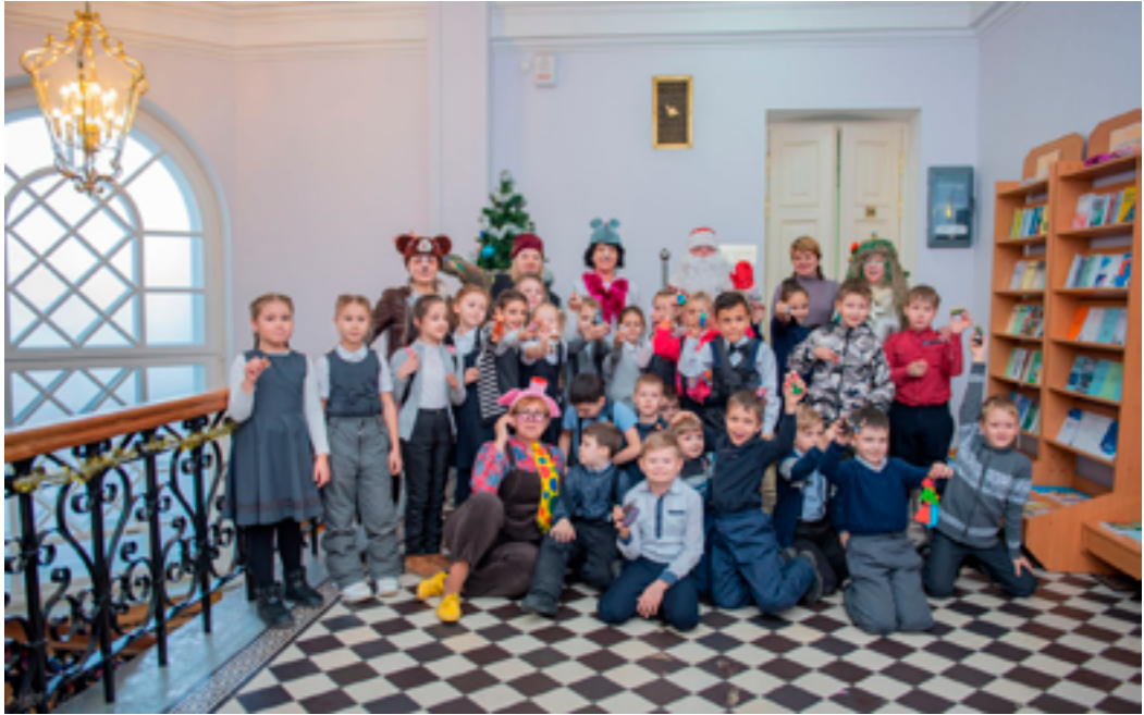
Организаторы и участники большой новогодней программы в ДВГНБ, декабрь 2019 года.