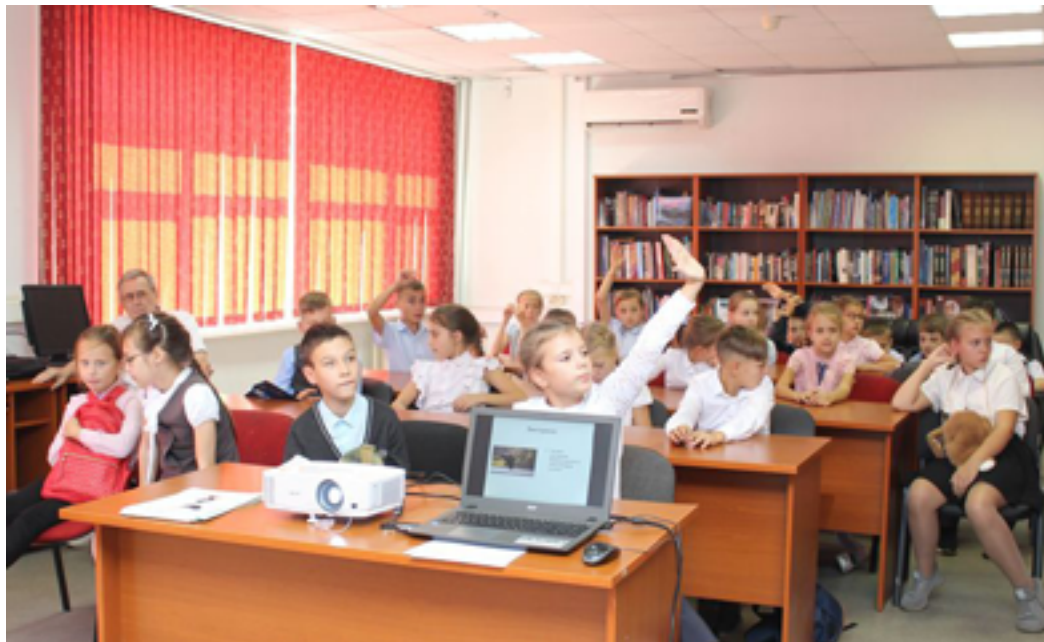
На празднике, посвящённом Всемирному дню журавля. ДВГНБ, ЦДЭРиМКК, 5 сентября 2019 года.