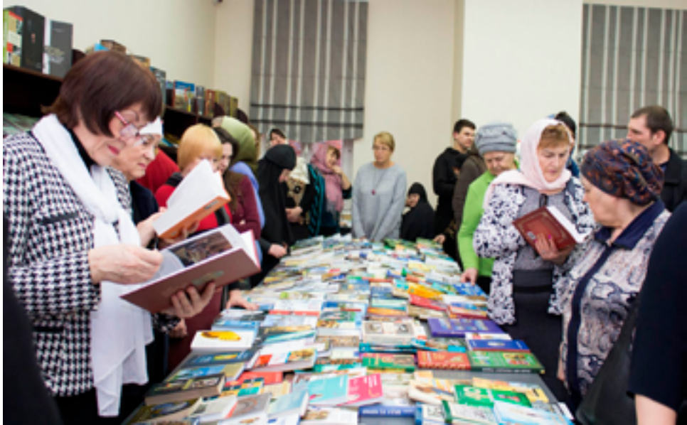
На книжной выставке-форуме «Книги, которые меняют жизнь – 2019». ДВГНБ, 20 марта 2019 года.