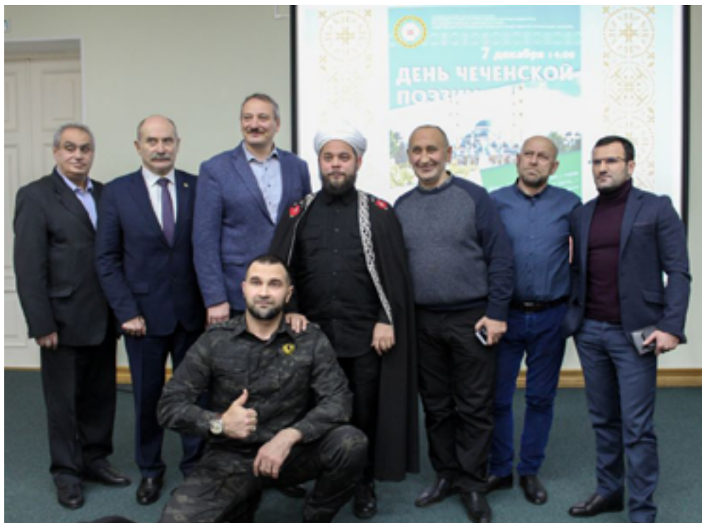
Организаторы и участники литературно-музыкальной встречи «День чеченской поэзии». ДВГНБ, 7 декабря 2019 года.