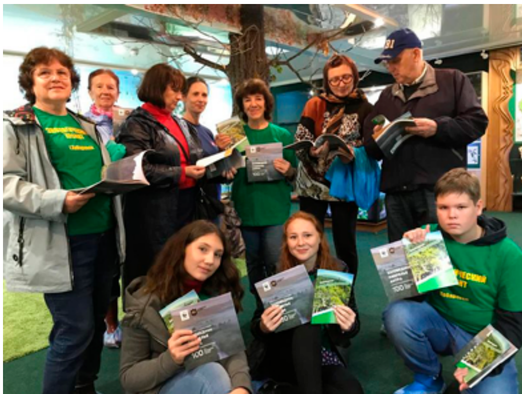
Участники проекта «Зелёное ожерелье города Хабаровска». Посёлок Бычиха, музей природы, 17 августа 2019 года.