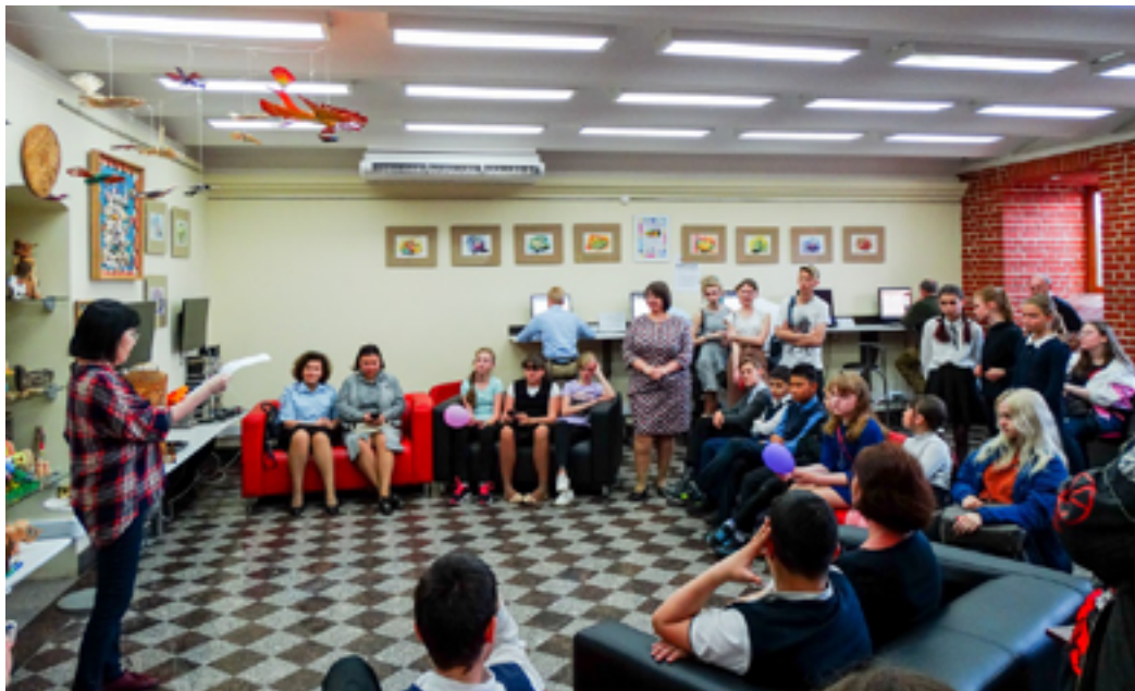
Участники V Международного фестиваля детского и молодёжного творчества «Дальний Восток России и Азиатско-Тихоокеанский регион: океан дружбы и мечты». ДВГНБ, 13 мая 2019 года.