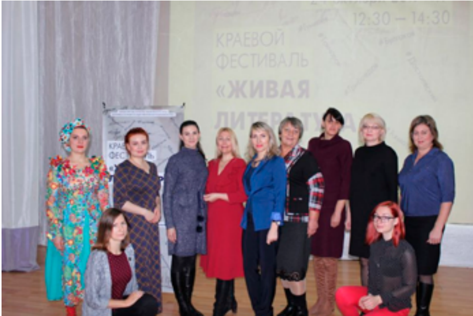
Организаторы и участники краевого молодёжного фестиваля «Живая литература». Село Селихино Комсомольского муниципального района, Центр славянской культуры «Славянский дом», 24 октября 2019 года.