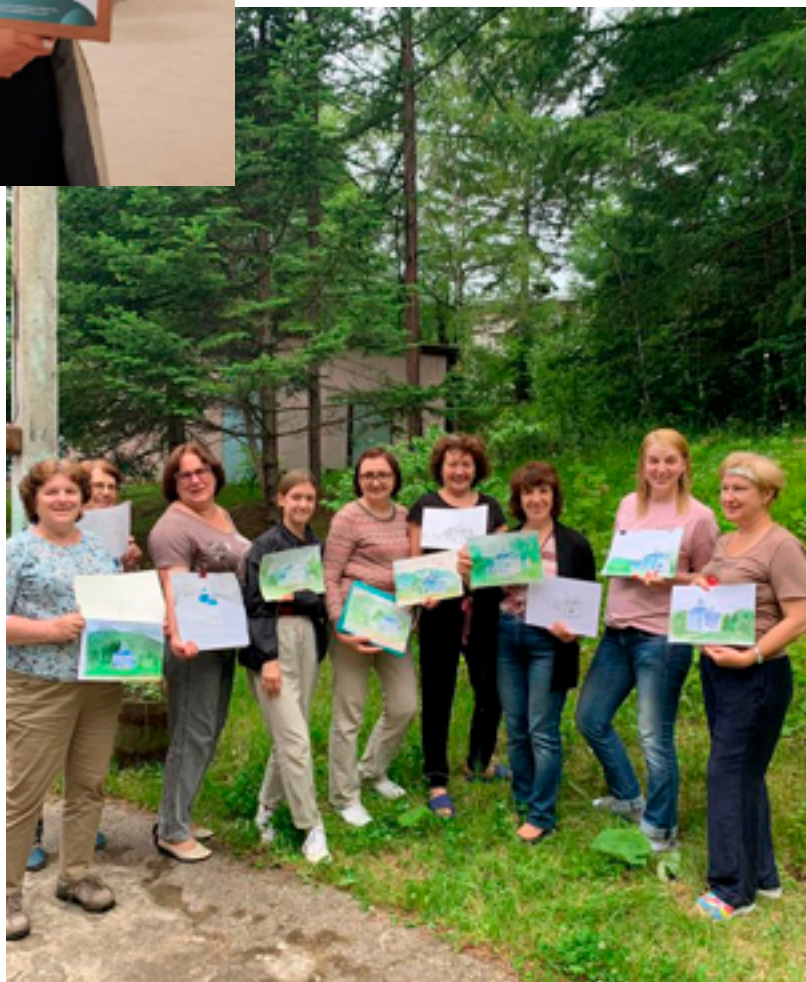
Участники проекта «Православные храмы Хабаровска». Посёлок Кульдур (ЕАО), 6 июля 2019 года.