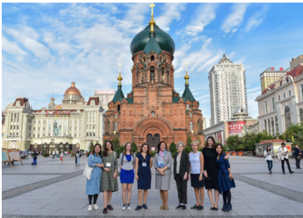
Делегация ДВГНБ и сотрудники Хэйлуницзянской провинциальной библиотеки. Харбин (КНР), собор святой Софии, сентябрь 2019 года.