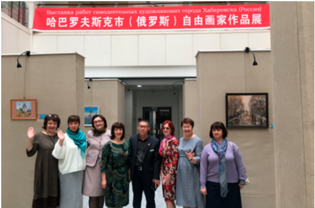
Самодеятельные хабаровские художники и генеральный директор Хэйлуницзянской провинциальной библиотеки Гао Вэньхуа на открытии выставки «Хабаровск — город на Амуре». Харбин (КНР), Хэйлуницзянская провинциальная библиотека, 30 апреля 2019 года.