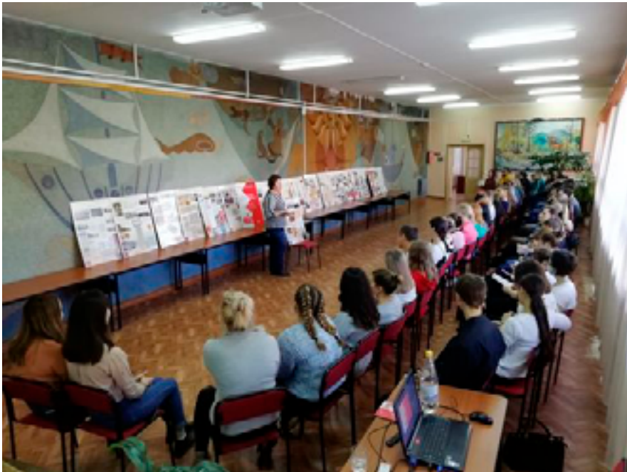
На презентации выставочного проекта «Эпоха раскола и противостояния». Николаевск-на-Амуре, Николаевская районная библиотека, 9 октября 2019 года.