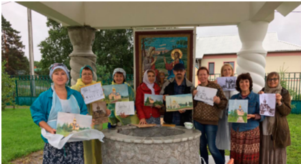
Участники пленэра в рамках проекта «Православные храмы Хабаровска». Село Петропавловка, Свято-Петропавловский женский монастырь, 11 августа 2019 года.