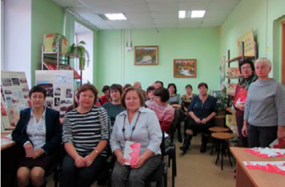
На презентации выставочного проекта «Эпоха раскола и противостояния». Вяземский, Центральная районная библиотека, 16 октября 2019 года.