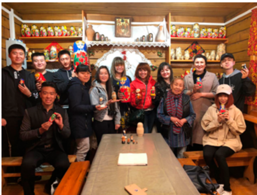
Участники экскурсии в «Русскую деревню» в рамках проекта «Национальная палитра Хабаровского края». Село Бычиха, 3 июня 2019 года.