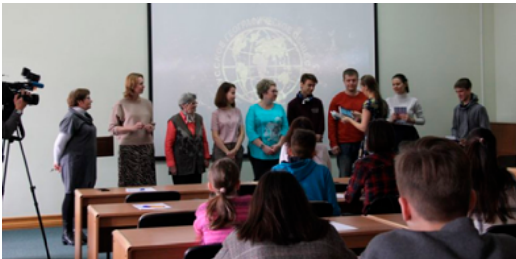
Участники «Географического диктанта». ДВГНБ, 27 октября 2019 года.