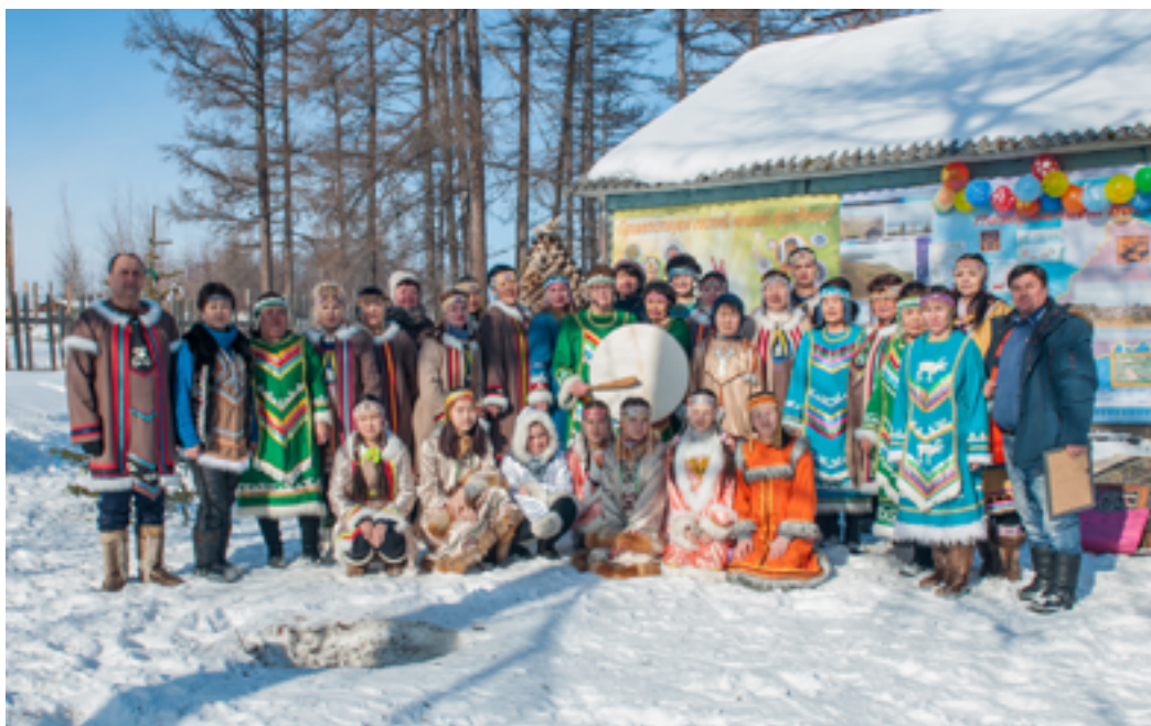
Участники фестиваля эвенкийской культуры «Бакалдын». Село Тугур, 2–3 марта 2019 года.