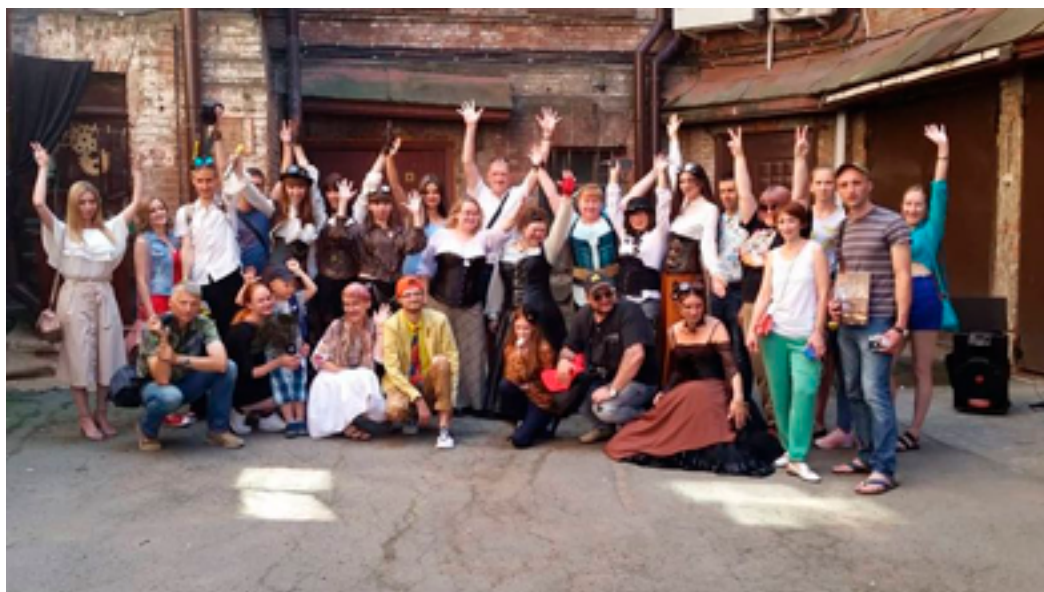
Участники Второго арт-фестиваля «Золотой компас – 2019», посвящённого Дню фотографа. ДВГНБ, исторический двор основного здания, 20 июля 2019 года.