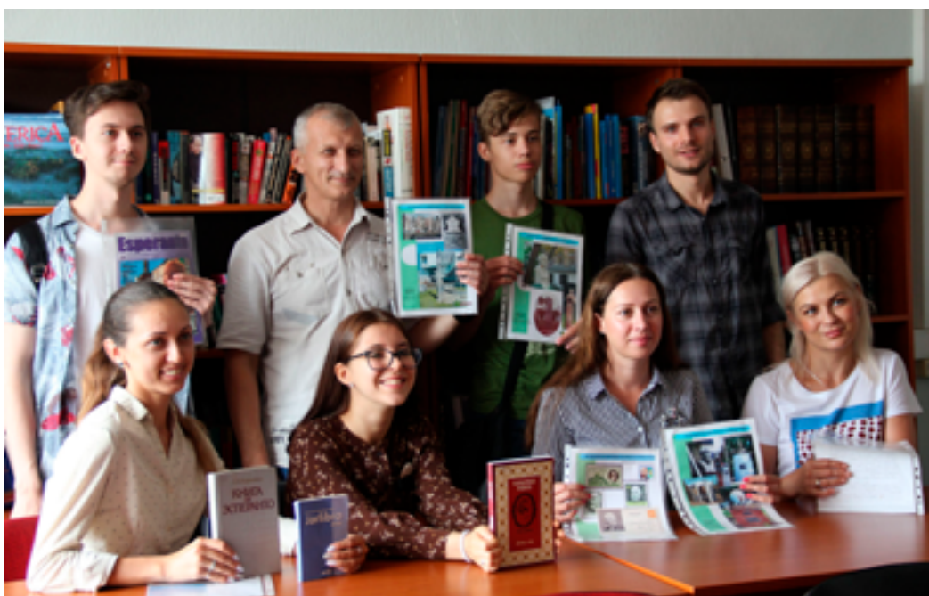
Участники встречи, посвящённой 132-й годовщине со дня создания международного языка эсперанто. ДВГНБ, ЦДЭРиМКК, 30 июля 2019 года.