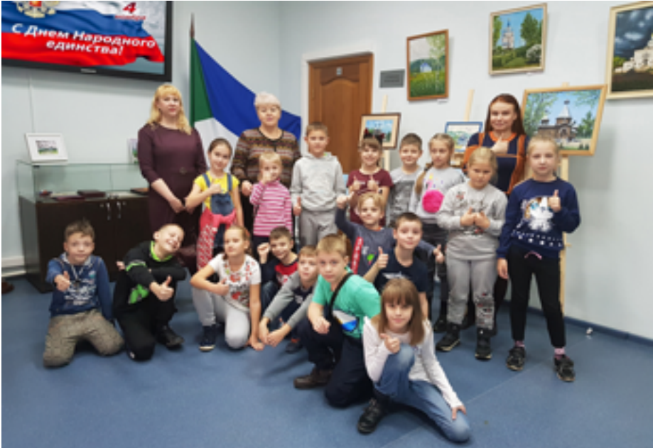
Посетители выставки «Православные храмы Приамурья». ДВГНБ, ХРЦПБ, ноябрь 2019 года.