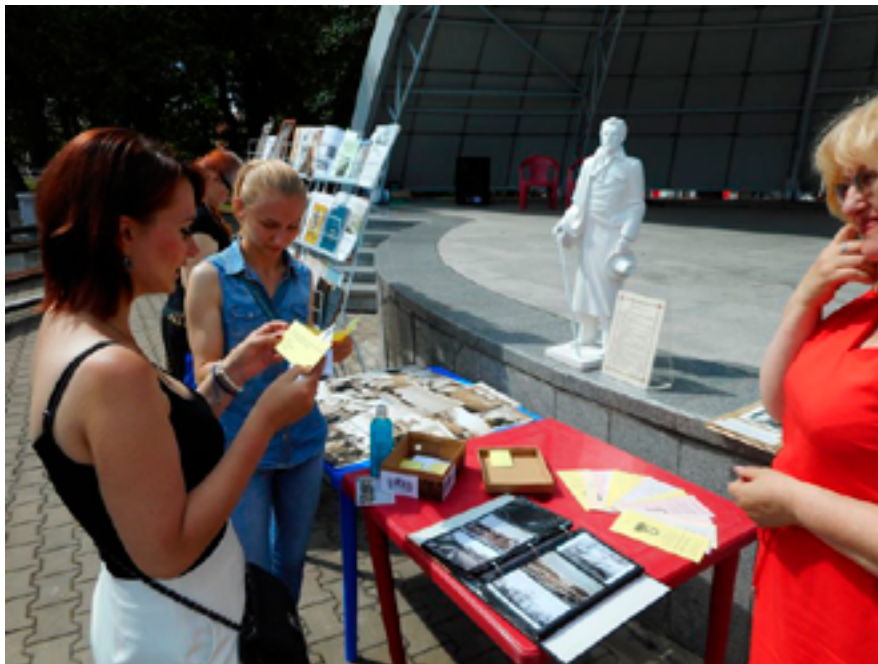
Акция «А. П. Чехов на амурских берегах» в рамках Всероссийской акции «Маршрутом Чехова по Сибири на Сахалин». Хабаровский краевой парк имени Н. Н. Муравьёва-Амурского, сцена «Ракушка», 16 июля 2019 года.