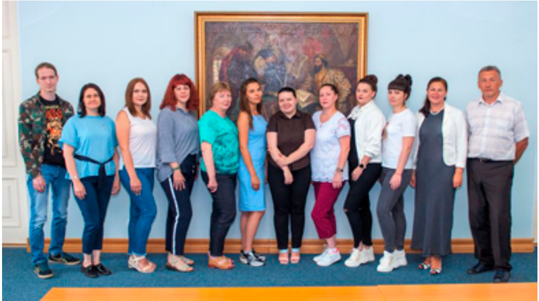
Сотрудники ДВГНБ и специалисты Верхнебуреинской межпоселенческой библиотечной системы. ДВГНБ, 22 июля 2019 года.