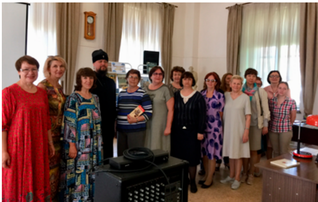
Архиепископ Биробиджанский и Кульдурский Ефрем, сотрудники Биробиджанской областной универсальной научной библиотеки имени Шолом-Алейхема, участники проекта «Православные храмы Хабаровска» на открытии книжной выставки «Православные храмы Приамурья». Биробиджан, БОУНБ, 8 июня 2019 года.