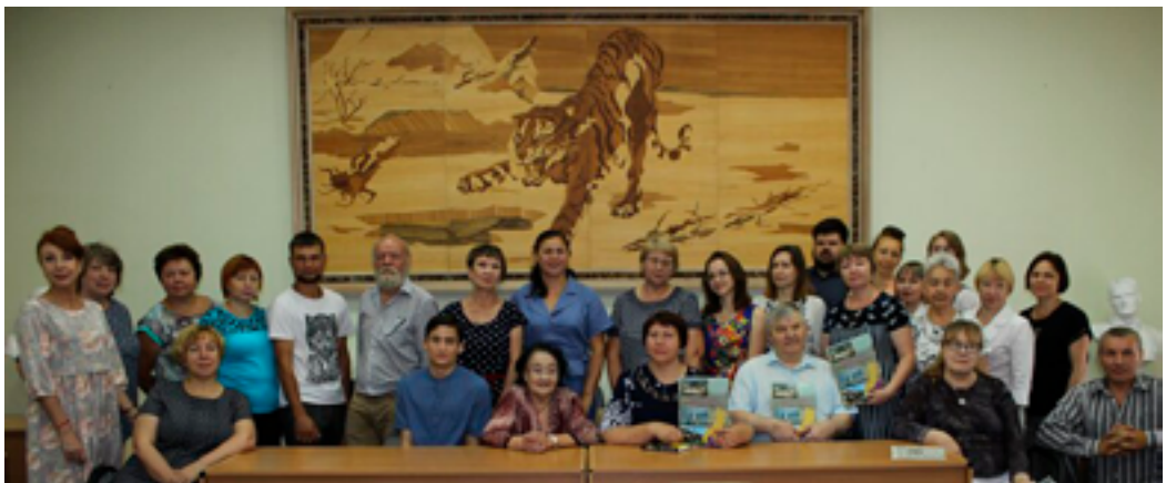
Участники презентации книги «Здесь мы живём, и край нам этот дорог» о Карымском районе Забайкалья. ДВГНБ, 23 июля 2019 года.