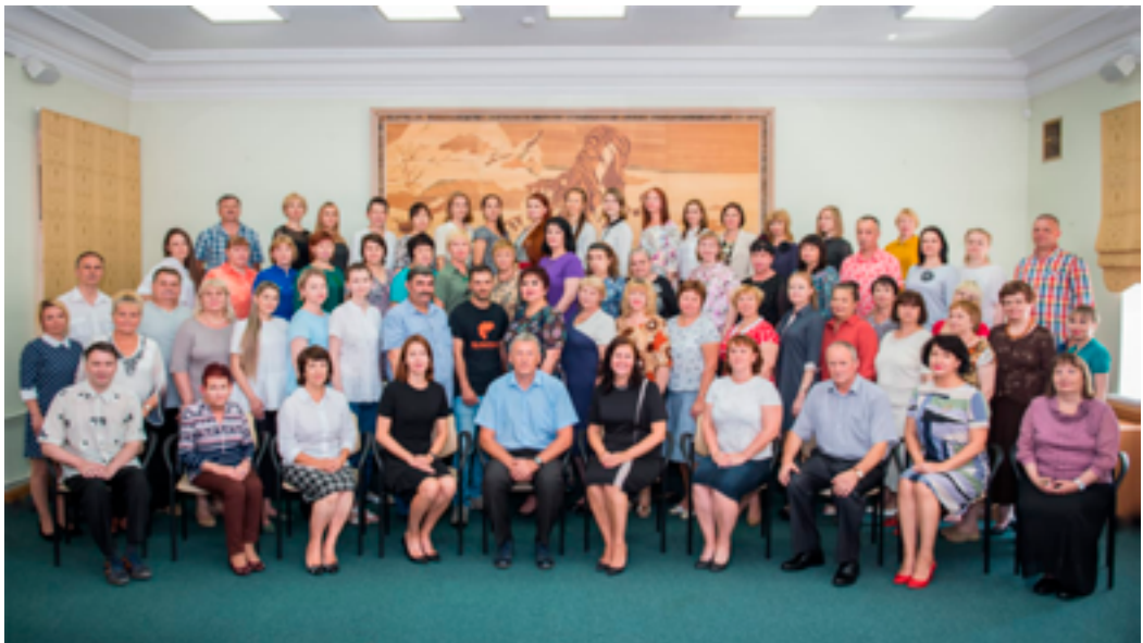
Коллектив ДВГНБ. Тигровый зал ДВГНБ, 8 августа 2019 года.