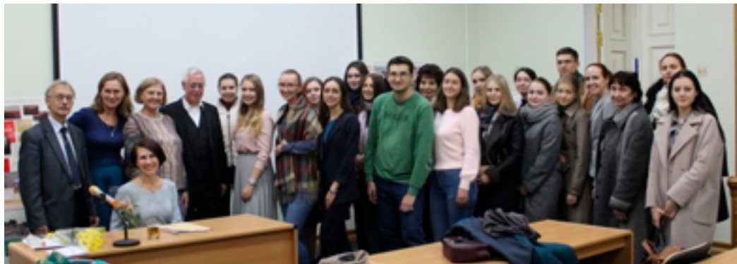
Участники мероприятия в рамках 22-х Дней российско-немецкой культуры в Хабаровске. ДВГНБ, октябрь 2019 года.