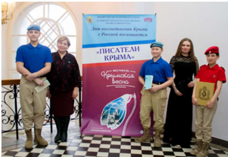
Участники фестиваля «Крымская весна». ДВГНБ, 18 марта 2019 года.