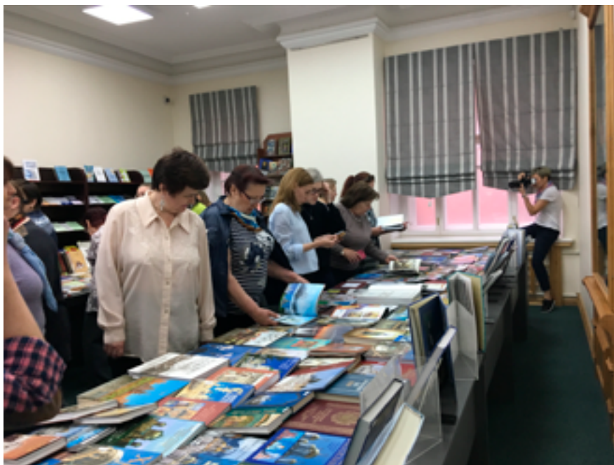
На книжной выставке «Православные храмы Приамурья». ДВГНБ, 24 мая 2019 года.