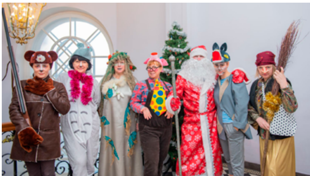
Сотрудники ДВГНБ — организаторы большой новогодней программы в ДВГНБ, декабрь 2019 года.