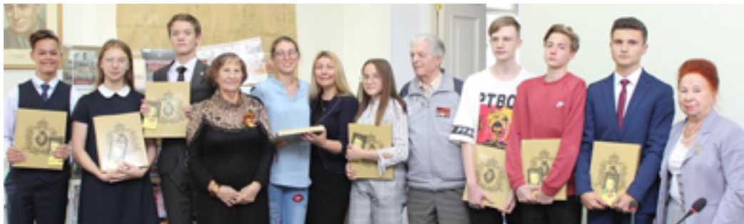
Организаторы и участники круглого стола «Вторая мировая война: подвиг народа и уроки истории». ДВГНБ, 13 сентября 2019 года.