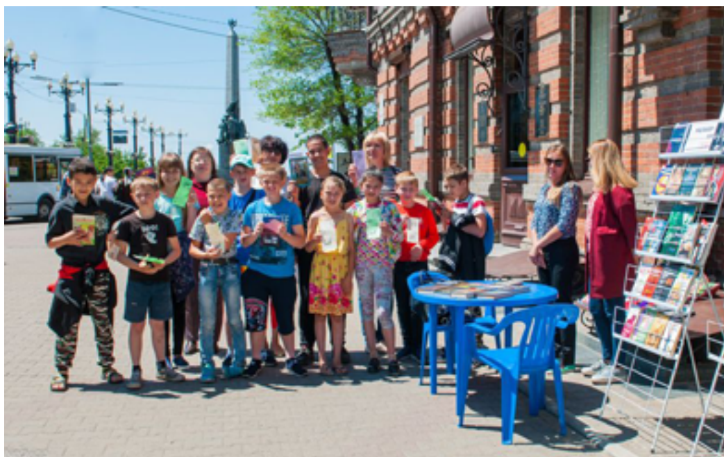
Уличная информационная акция «Скажи наркотикам — НЕТ!». Ул. Муравьёва-Амурского, 1, основное здание ДВГНБ, 18 июня 2019 года.