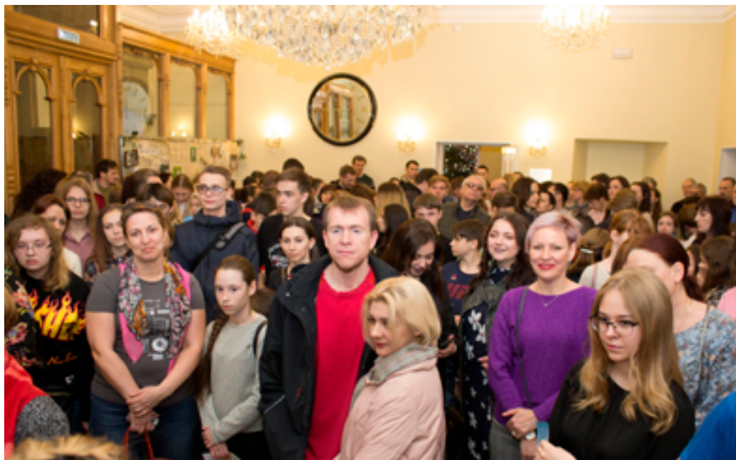
Всероссийская акция «Библионочь-2019». ДВГНБ, 21–22 апреля 2019 года.