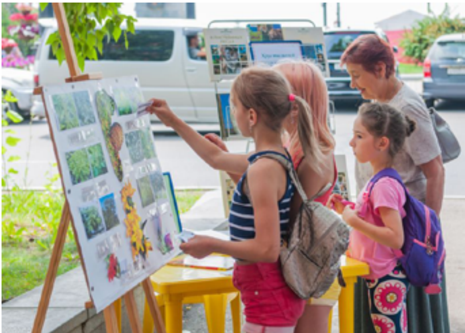
Экологическая информационно-просветительская акция «Хрустальный мир дальневосточной природы». Летний читальный зал (ул. Тургенева, 72), 11 июля 2019 года.