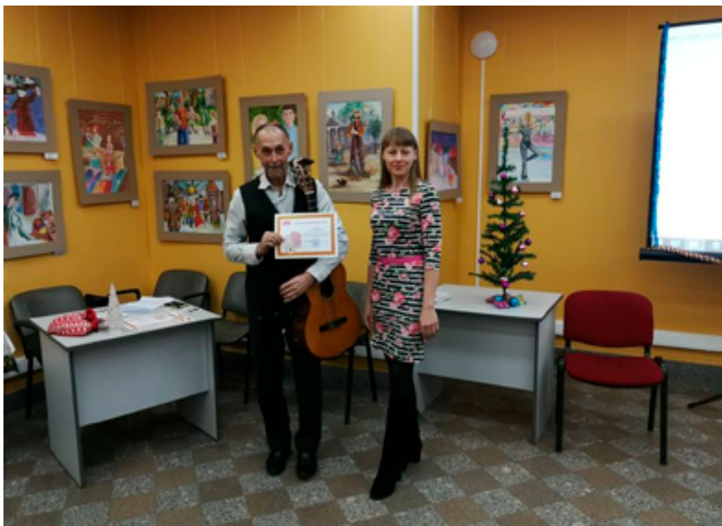
Участники юбилейного заседания литературной площадки «АМУРiЯ» под названием «АМУРiЯ собирает друзей», посвящённого её пятилетию. ДВГНБ, ЦДЭРиМКК, 18 декабря 2019 года.