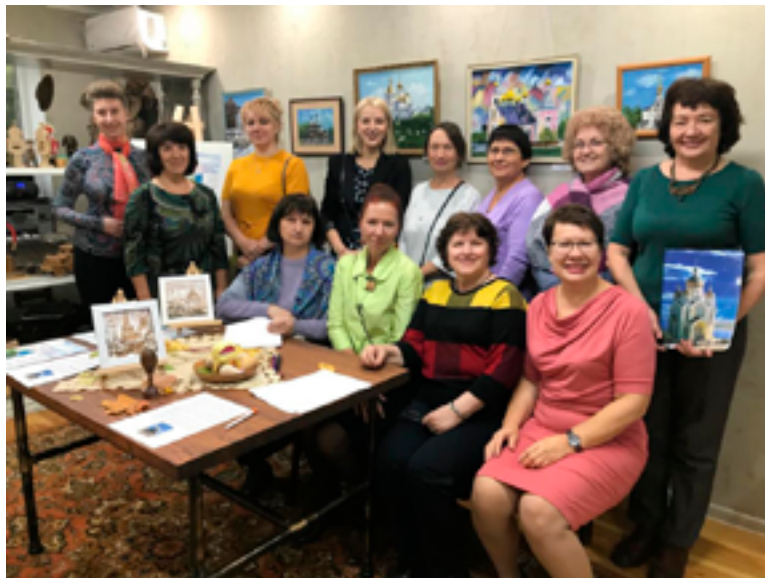
Участники проекта «Православные храмы Хабаровска» на открытии выставки «Православные храмы Приамурья». Хабаровск, галерея «Hand of art», 11 октября 2019 года.