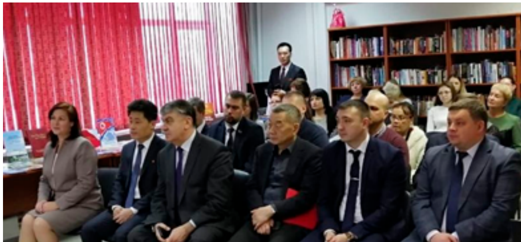
На презентации фотовыставки «Бессмертное дело вождя корейского народа». ДВГНБ, ЦДЭРиМКК, 17 декабря 2019 года.