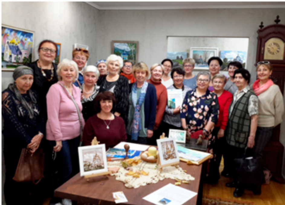
Члены Союза пенсионеров Хабаровского края на выставке «Православные храмы Приамурья». Хабаровск, галерея «Hand of art», 21 октября 2019 года.