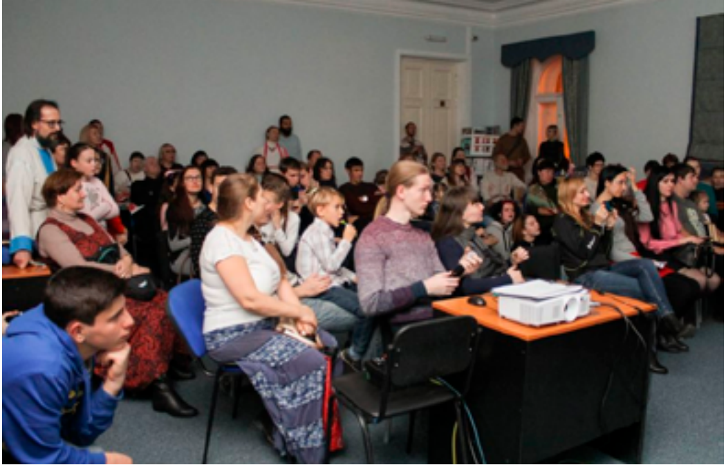
На мероприятии в рамках проекта «Ночь искусств». ДВГНБ, 3 ноября 2019 года.