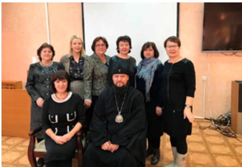
Архиепископ Биробиджанский и Кульдурский Ефрем и участники проекта «Православные храмы Хабаровска». Биробиджан, социально-просветительский центр Биробиджанской епархии РПЦ, 21 декабря 2019 года.