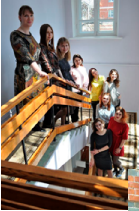
Представители молодёжного объединения ДВГНБ «Лидер будущего» в ХРЦПБ, 31 июля 2019 года.