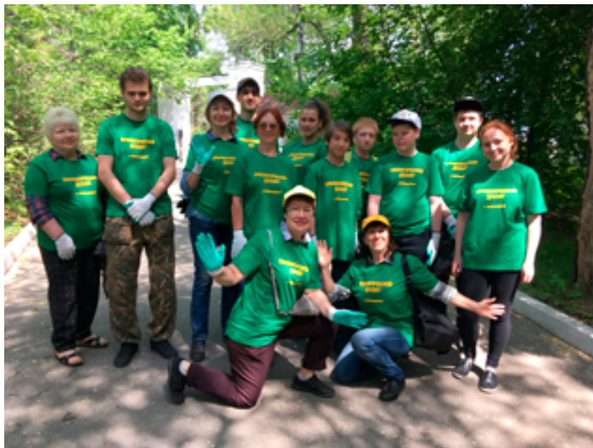
Экологический десант в Хабаровском дендрарии в рамках проекта «Зелёное ожерелье города Хабаровска». 26 мая 2019 года.