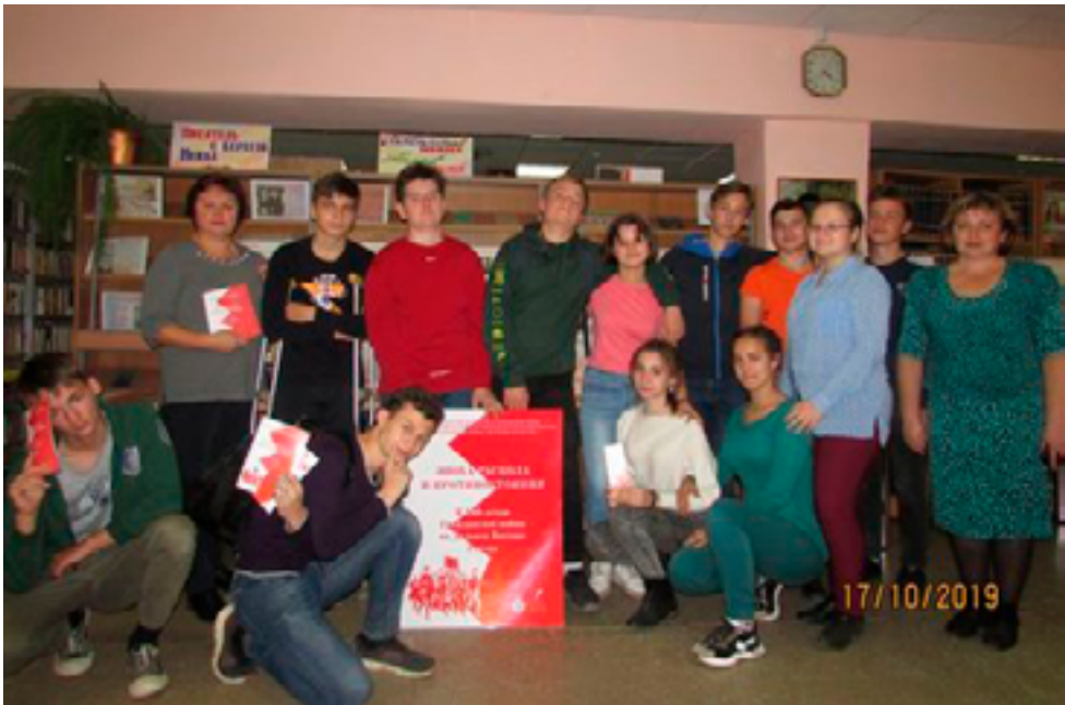
Участники презентации выставочного проекта «Эпоха раскола и противостояния». Бикин, Центральная районная библиотека, 17–18 октября 2019 года.