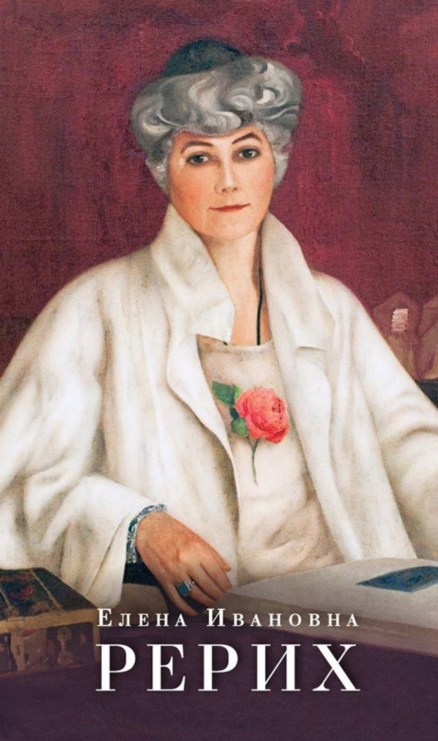
ЕЛЕНА ИВАНОВНА РЕРИХ