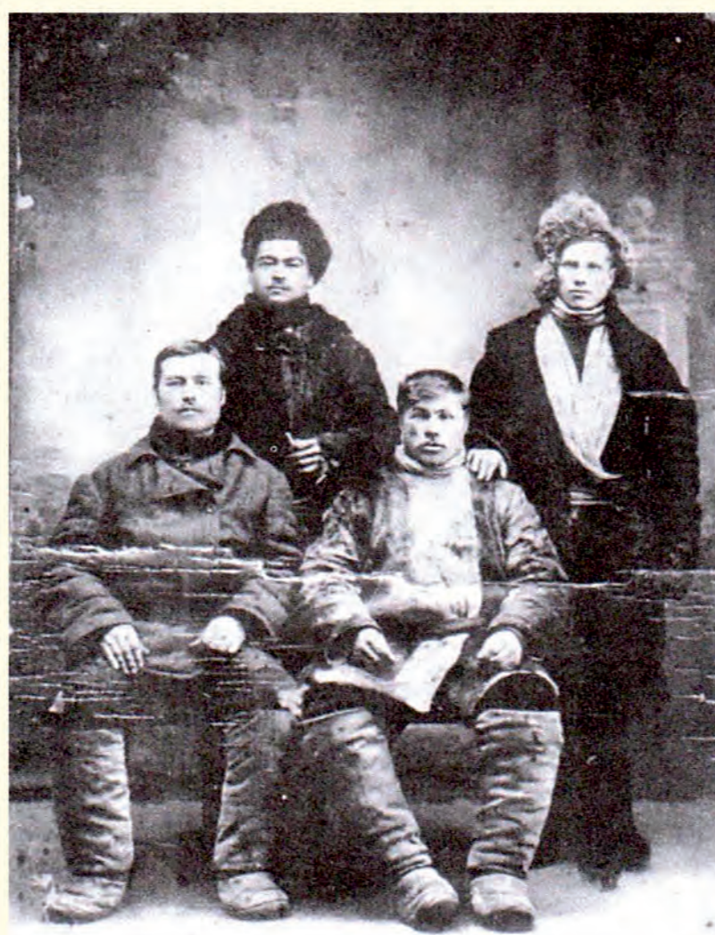
Партизаны с. Удинское