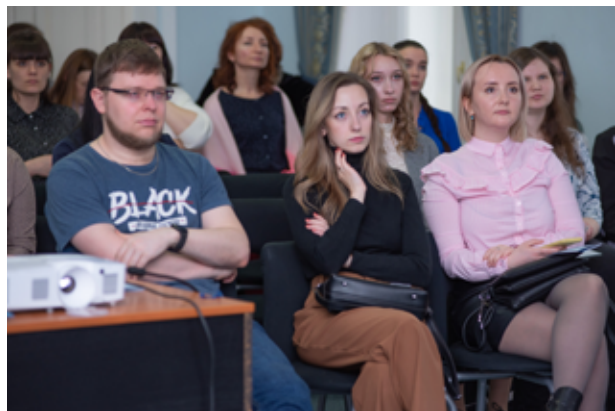
Участники V межрегионального форума молодых библиотекарей «Лидер будущего».

В системе библиотечной деятельности особое место занимает гражданско-патриотическое воспитание молодого поколения. О мероприятиях, которые проводят-