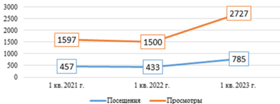
Диаграмма 1. Показатели развития группы BookIsland «ВКонтакте» [5; 6].