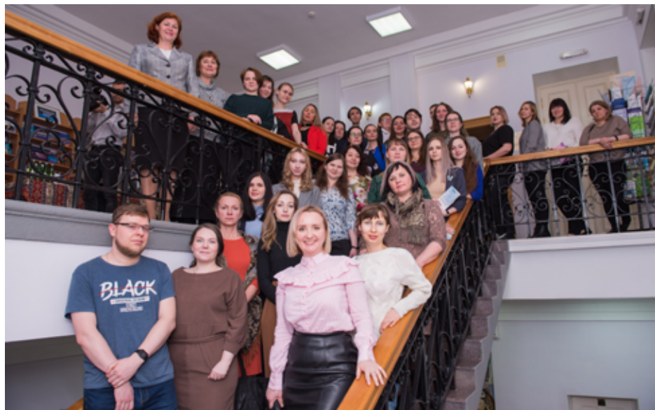
Общая фотография участников V межрегионального форума молодых библиотекарей «Лидер будущего».

Молодёжь — это очень важный кадровый ресурс любого учреждения культуры. И оттого, насколько молодые специалисты будут проявлять свою креативность, открытость к новым идеям, принимать активное участие в жизни библиотеки, зависит её настоящее и будущее.