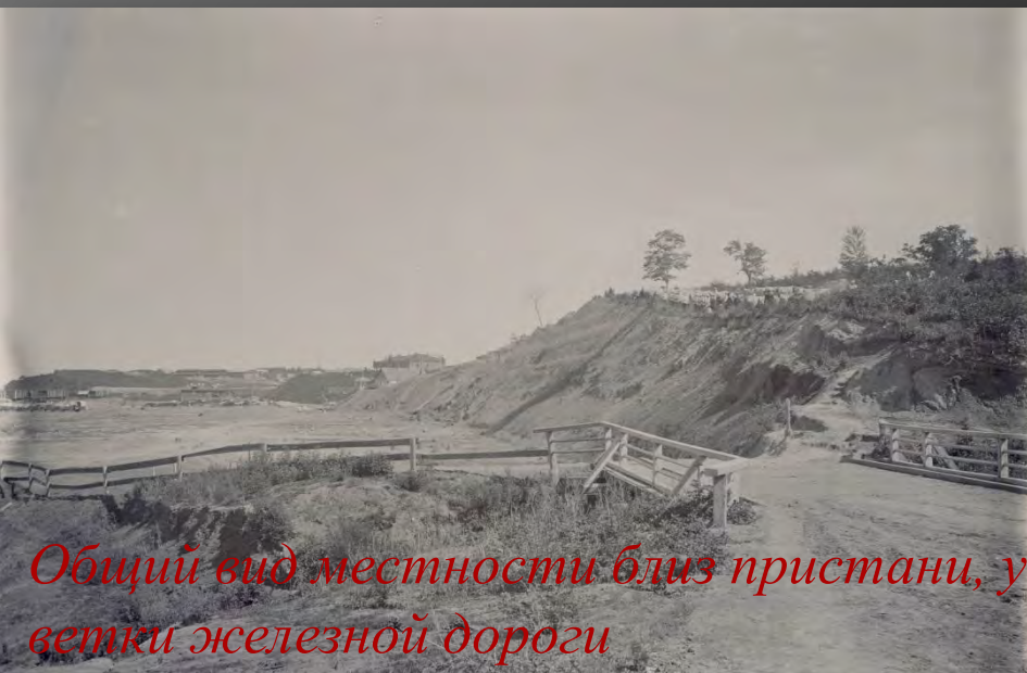
Общий вид местности близ пристани, у ветки железной дороги