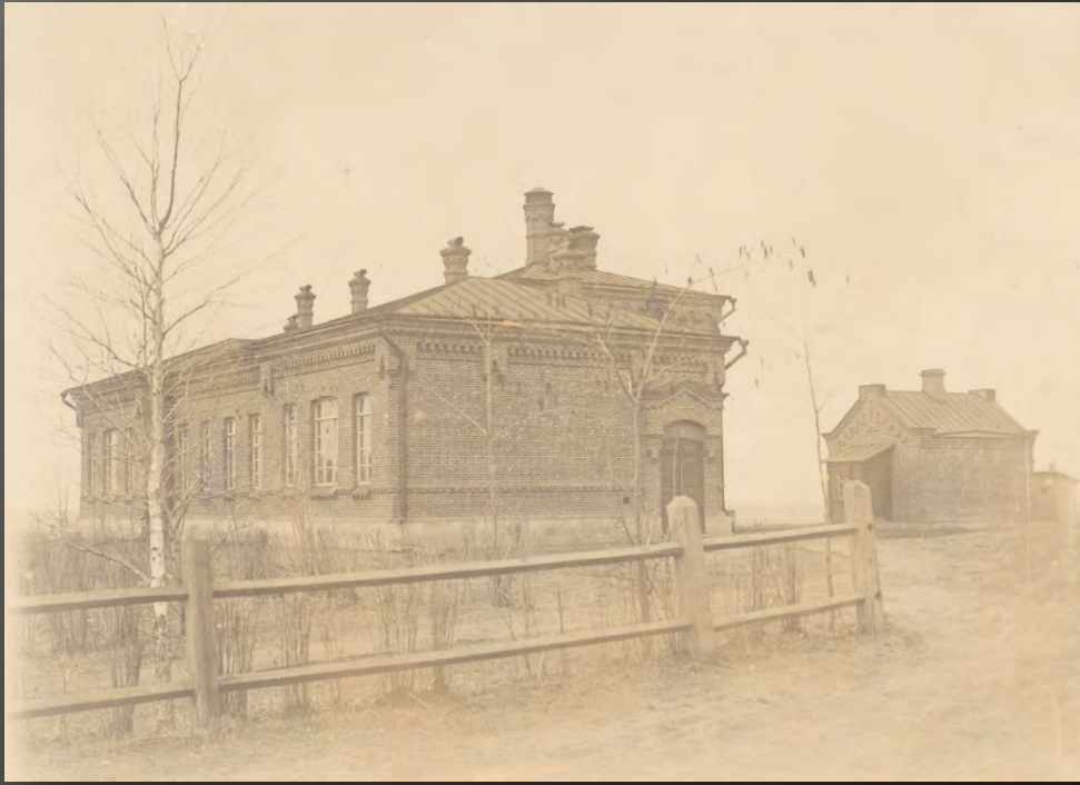
Г. Хабаровск - Полугоспиталь. - Заразный навильон и дезинфекционная камера.