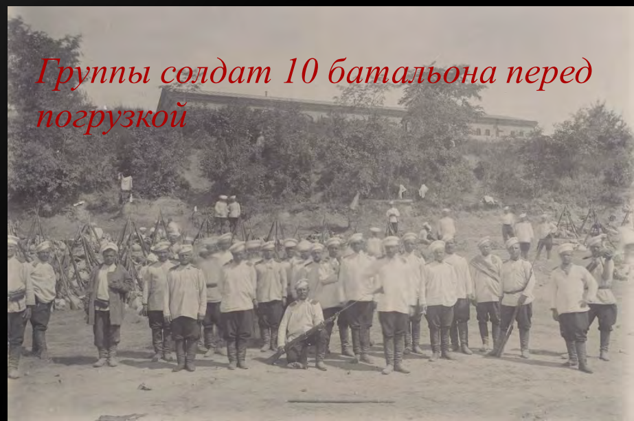
Группы солдат 10 батальона перед погрузкой