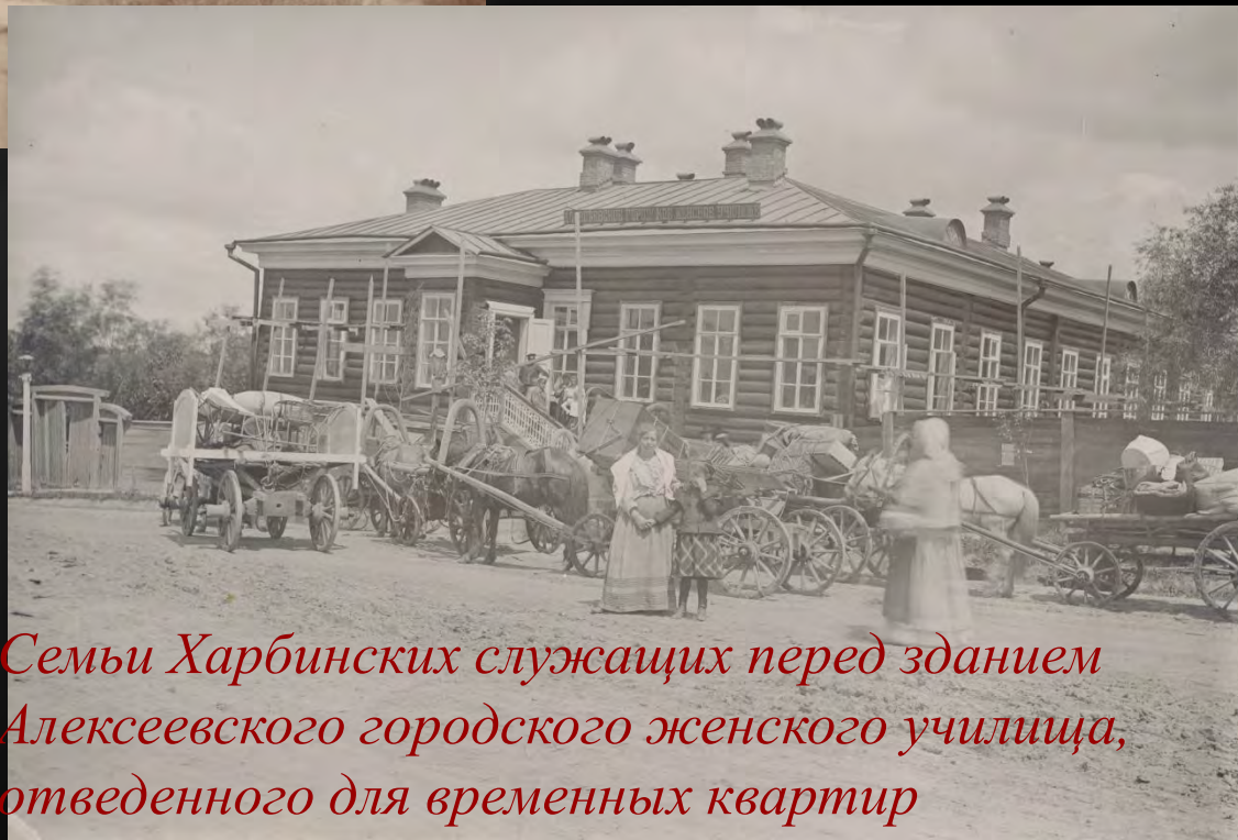
Семьи Харбинских служащих перед зданием Алексеевского городского женского училища, отведенного для временных квартир