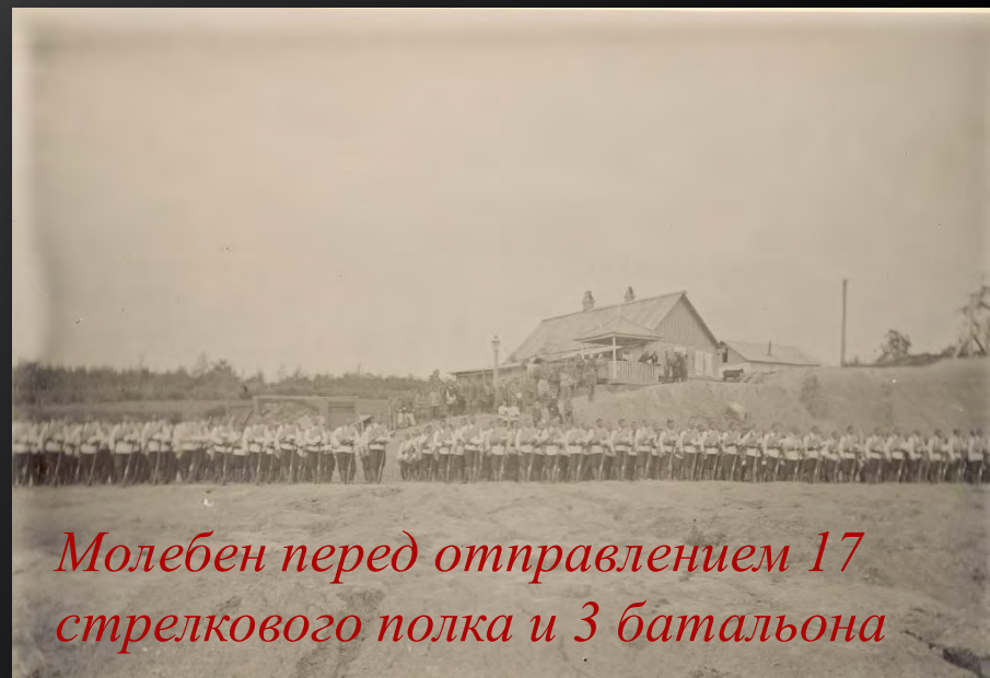
Молебен перед отправлением 17 стрелкового полка и 3 батальона