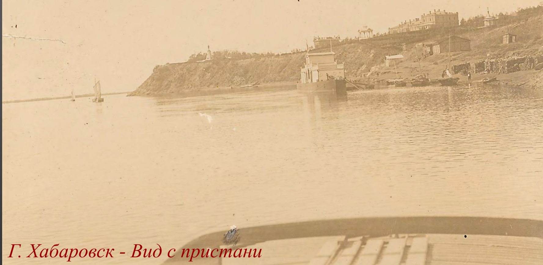
Г. Хабаровск - Вид с пристани

Фотоальбом «[Хабаровск и его окрестности]», приблизительно 1897 г.