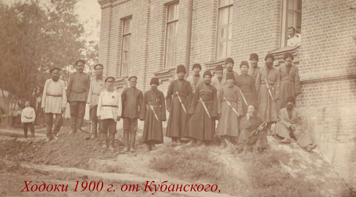
Ходоки 1900 г. от Кубанского, Терского, Донского и Оренбургского казачьих войск