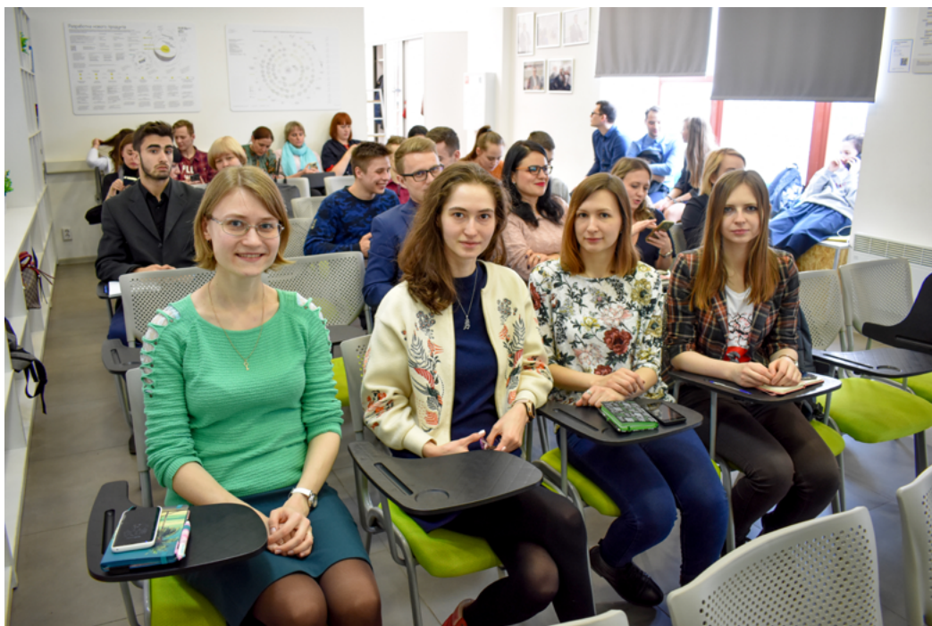
Молодые библиотекари ДВГНБ в «Точке кипения».

Среди основных форм реализации государственной молодёжной политики за последние несколько лет наибольшее распространение получил социальный проект. Каждый год Федеральное агентство по делам молодёжи проводит несколько конкурсов на получение финансовой поддержки лучших молодёжных инициатив. В нашем регионе также существуют грантовые конкурсы для молодого поколения, а в апреле 2019 года будет запущен конкурс молодёжных проектов на гранты губернатора Хабаровского края. Об этом хабаровской молодёжи рассказали в коворкинг-центре «Точка кипения».