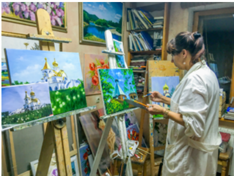
Работа в студии изобразительного искусства «3D (Душа Домашнего Дизайна)». 2019 год.