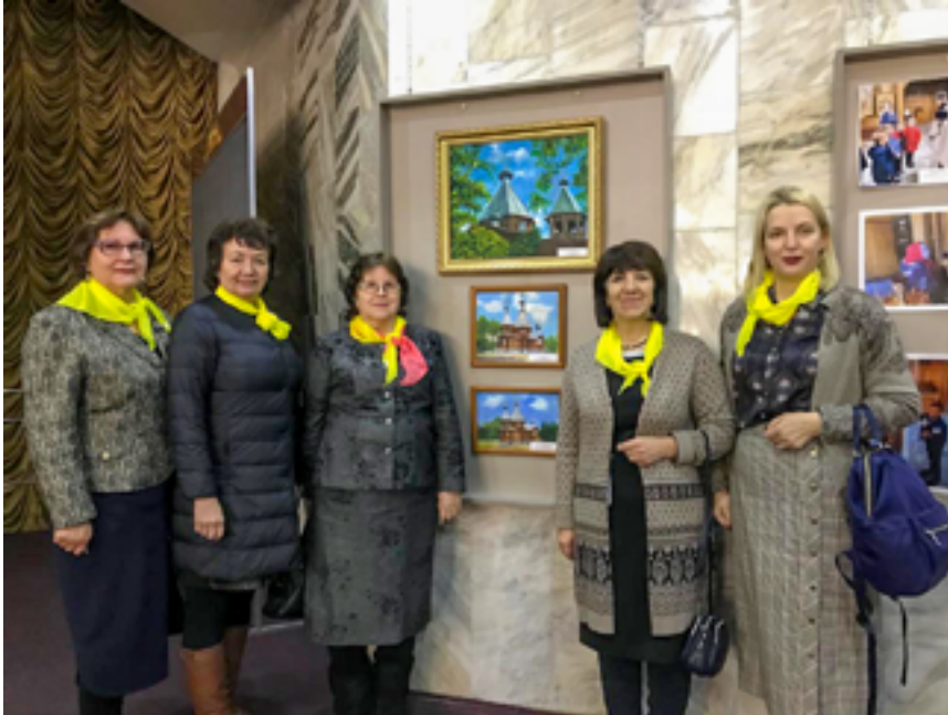
Участники проекта в Биробиджанской областной филармонии. 21 декабря 2019 года.