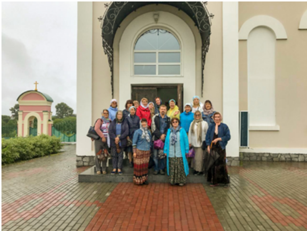
В Свято-Петропавловском женском монастыре. Село Петропавловка. 11 августа 2019 года.

в районе села Князе-Волконского и Петропавловское озеро вышли из своих берегов и затопили все прилегающие низкие места. Практически не прекращаясь, шёл дождь. Но путешествию это не мешало, вода нигде не вышла на автомобильную трассу. История существования монастыря насчитывает 16 лет, совсем немного для святой обители, однако монастырь стал тем местом, куда отправляются паломники со всего Дальнего Востока.