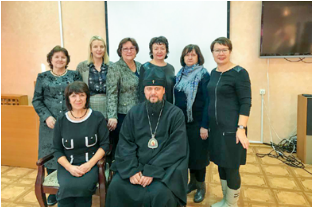
Участники проекта и архиепископ Биробиджанский и Кульдурский Ефрем. Биробиджан. 21 декабря 2019 года.