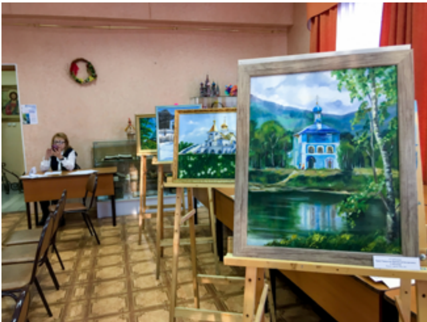
Выставочная экспозиция в социально- просветительском центре Биробиджанской епархии Русской православной церкви. 26 ноября 2019 года.