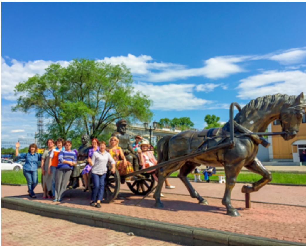
Участники проекта у памятника первым переселенцам. Биробиджан, 8 июня 2019 года.

Далее эстафету проекта приняла гостеприимная биробиджанская земля. 8–9 июня группа самодеятельных художников и организаторы проекта выехали в Биробиджан. В Биробиджанской областной универсальной научной