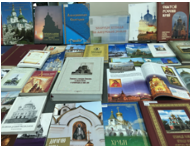
Выставка «Православные храмы Приамурья» в ДВГНБ.

Целевой группой проекта выступили граждане пенсионного возраста, а благополучателями проекта стала группа самодеятельных художников — членов студии «3D (Душа Домашнего Дизайна)» и творческой группы «Весёлая компания».