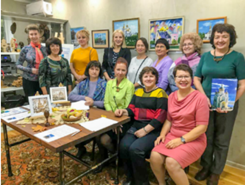
Участники проекта и посетители выставки в галерее «Hand of art». 11 октября 2019 года.