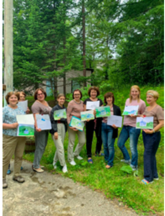
Участники пленэра в посёлке Кульдур. 6 июля 2019 года.

архиепископом Биробиджанским и Кульдурским Ефремом, настоятелем храма святителя Николая отцом Георгием, протоиереем, клириком храма Благовещения Пресвятой Богородицы г. Биробиджана Евгением Копысовым, иереем Евгением Четверговым, жителями города предоставили возможность участникам мероприятий окунуться в мир православной культуры.