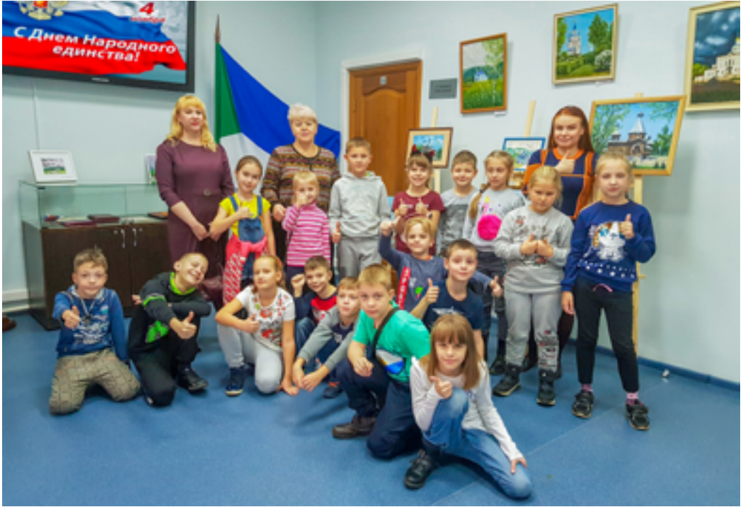
На выставке в Дальневосточной государственной научной библиотеке. Октябрь 2019 года.