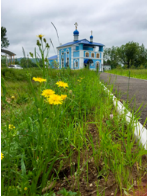
Храм Рождества Пресвятой Богородицы. Посёлок Кульдур.