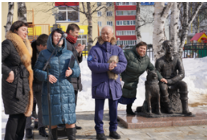
На открытии скульптурной композиции «Одинокий нивх».