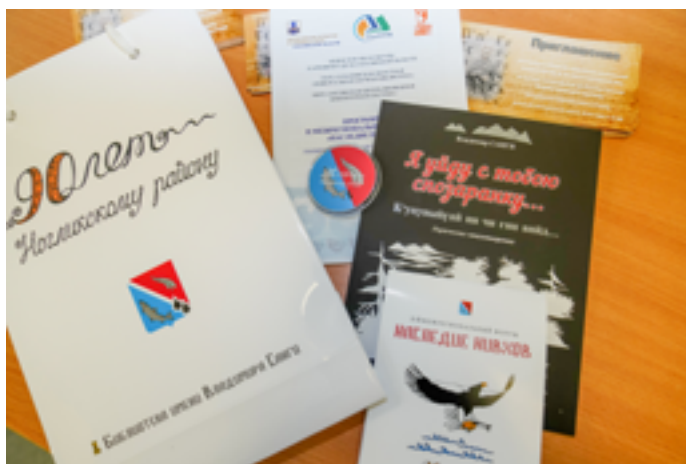
Информационные материалы форума.

Учёные, сотрудники областных и районных библиотек, музейные работники, представители нефтегазодобывающих компаний на протяжении двух дней делились опытом и планами на будущее с целью сохранить традиции коренных малочисленных народов Севера Сахалина