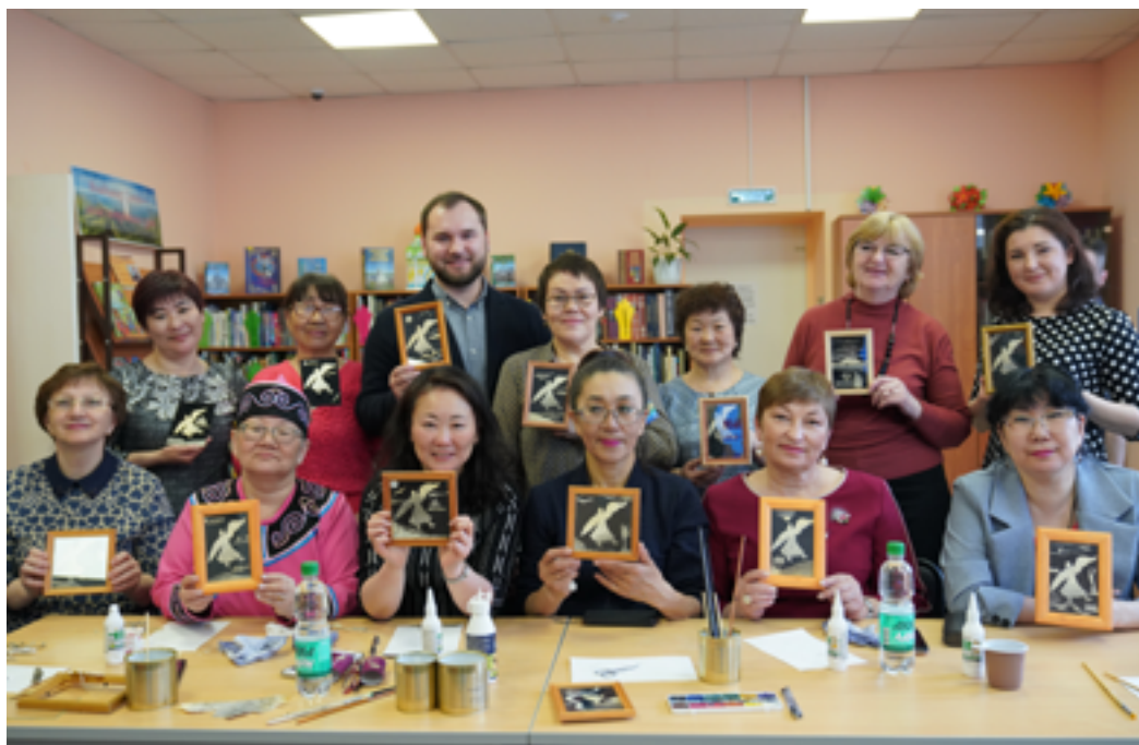
Участники мастер-класса по изготовлению панно с графикой на рыбьей коже по сказке «Девочка-лебедь. Кыкык» со своими работами.