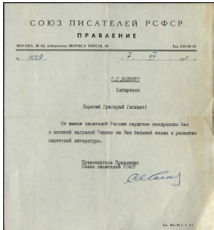
Письмо от 7 июля 1971 года из правления Союза писателей РСФСР, подписанное председателем Сергеем Владимировичем Михалковым. Поздравление с награждением орденом Трудового Красного Знамени.

Оцифровка и размещение в Интернете произведений Г. Г. Ходжера, документов о его жизни и деятельности сделают их доступными для молодёжи, которую разработчики и исполнители проекта рассматривают как целевую группу.