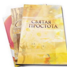
Журналы и сборники

Страница интернет-ресурса «Литературный мир Сахалина и Курил».