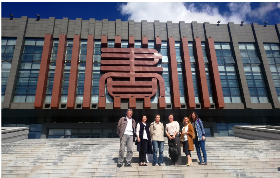
У здания библиотеки. Древние иероглифы на фасаде означают слово «книга».

Мы побывали в Дацинской городской библиотеке. Пятиэтажное здание современной архитектуры (общая площадь — 35 тыс. кв. метров) поражает своим размахом. Библиотека была открыта в 2014 году и является преемницей старой, заложенной ещё в 1949 году. Как дань памяти об этом, в одном из холлов новой библиотеки экспонируется в качестве предмета старины деревянный шкафчик с каталожными ящиками и бумажной картотекой.