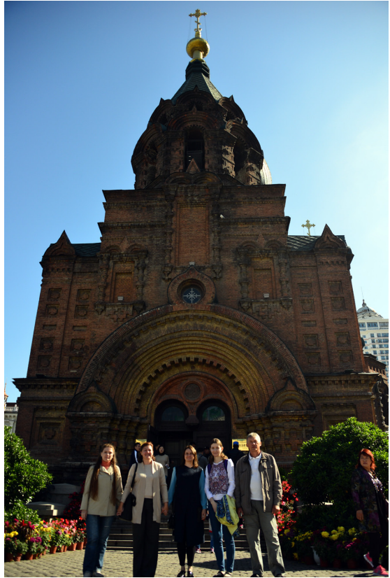
У Софийского собора.