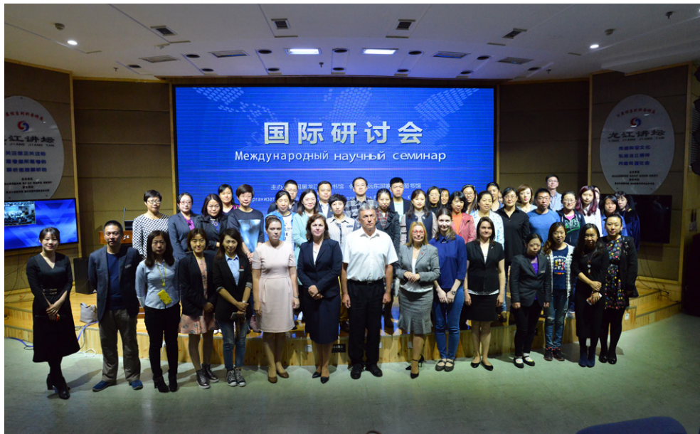
Российская делегация и сотрудники вузовских и муниципальных библиотек Харбина.