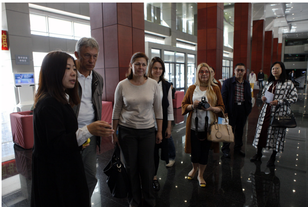
В Дацинской городской библиотеке.

составлению генеалогического древа по запросу любого читателя. Ещё один замечательный проект — это приобретение книги для читателя. Допустим, он увидел в книжном магазине интересное издание, но не может его купить. Библиотека за него покупает эту книгу, а после прочтения читатель сдаёт её в библиотеку. Таким образом библиотека завоёвывает не только популярность среди населения, но и пополняет свои фонды действительно востребованной литературой. Не забыли в библиотеке и про любителей гаджетов. В центральном холле установлен сенсорный киоск, где любой желающий может через QR код скачать интересующую его книгу.