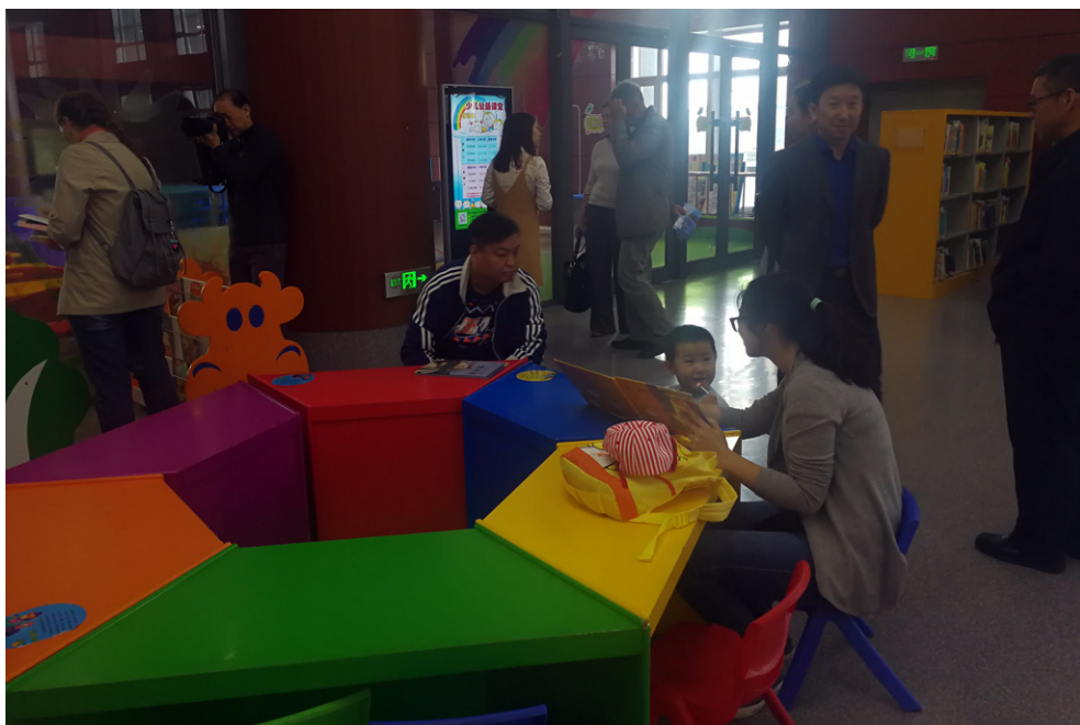
В детской библиотеке.

Нам удалось побывать в нескольких отделах и залах. Это и детская библиотека, где есть зал не только для школьников, но и для совсем маленьких детей, которым книги здесь читают родители; оборудованы и детская комната, и компьютерный класс. Посетили мы читальный зал старинной книги (фонд — 8 тыс. книг). Самая древняя из них датируется 1350 годом (династия Мин), её библиотека приобрела самостоятельно в магазине старинной книги в Пекине (государство выделяет бюджет на такие цели). Есть и музыкально-нотный отдел с экраном для видеопросмотров, и кинозал, где по субботам и воскресеньям бесплатно показывают фильмы, и зал периодики, и отдел буккроссинга, и конференц-зал, и огромный концертный зал для выступлений творческих коллективов города, и выставочный зал. Предусмотрены места и для самообразования читателей, творческие мастерские для детей, зал круглосуточного самообслуживания, который в Китае пользуется