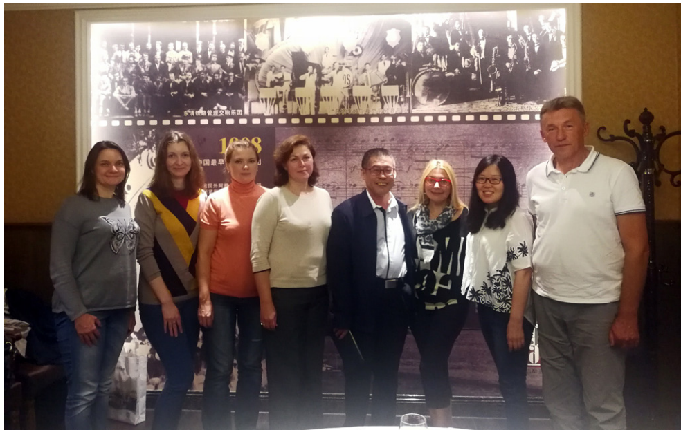
Российская делегация и представители Хэйлунцзянской провинциальной библиотеки (11 сентября 2017 г.).

С 11-го по 15 сентября 2017 года делегация специалистов Дальневосточной государственной научной библиотеки (ДВГНБ) посетила Хэйлунцзянскую провинциальную библиотеку (ХПБ) по линии регулярных обменов по вопросам культурного взаимодействия и изучения опыта организации библиотечной работы.