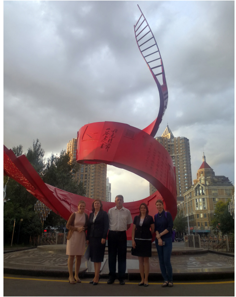
У Хэйлунцзянской провинциальной библиотеки.

13 сентября до начала форума нам удалось посетить несколько отделов в этом огромном шестиэтажном здании. Среди них — фонд русской книги, который насчитывает порядка 8 тысяч книг и состоит из трёх разделов: книги до 1912 года (около 1 тыс. изданий); до 1949 года и второй половины XX века. Первые два — это в основном эмигрантское наследие (книги, фотоальбомы, периодика из частных собраний, библиотек русских вузов Харбина, научных обществ, юридических организаций). Здесь запрещено фотографировать! Весь фонд находится в режиме хранения и никому из читателей не доступен. По словам