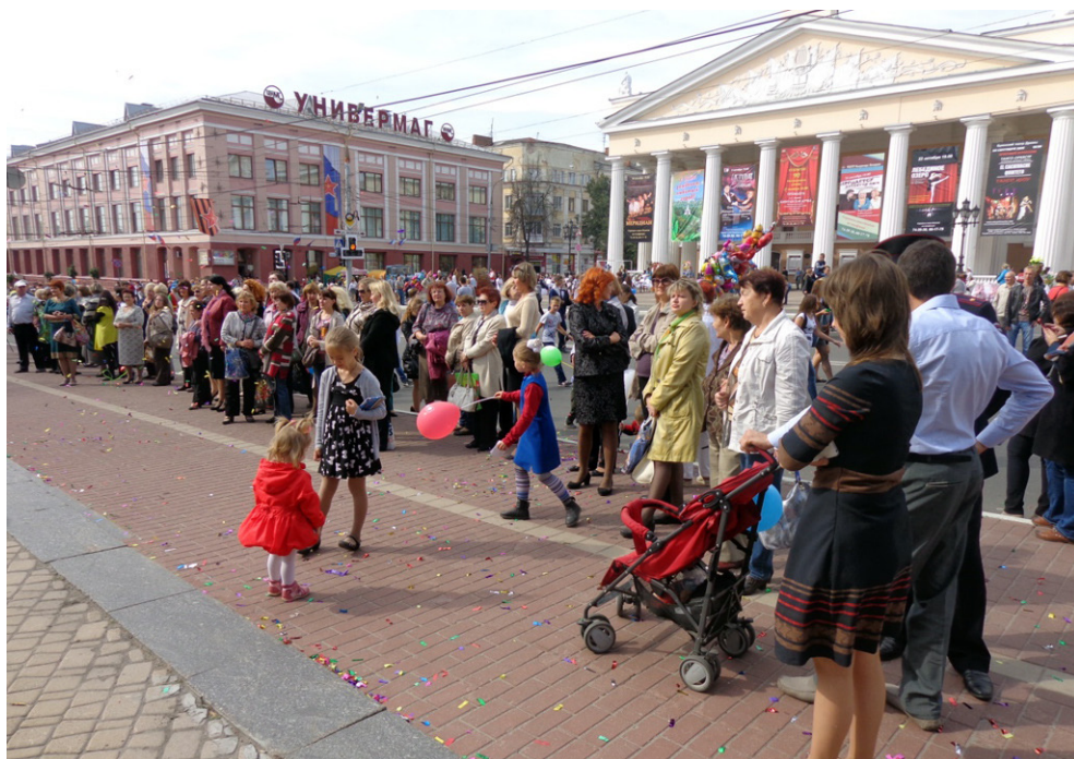
Литературная акция на центральной городской площади Брянска.