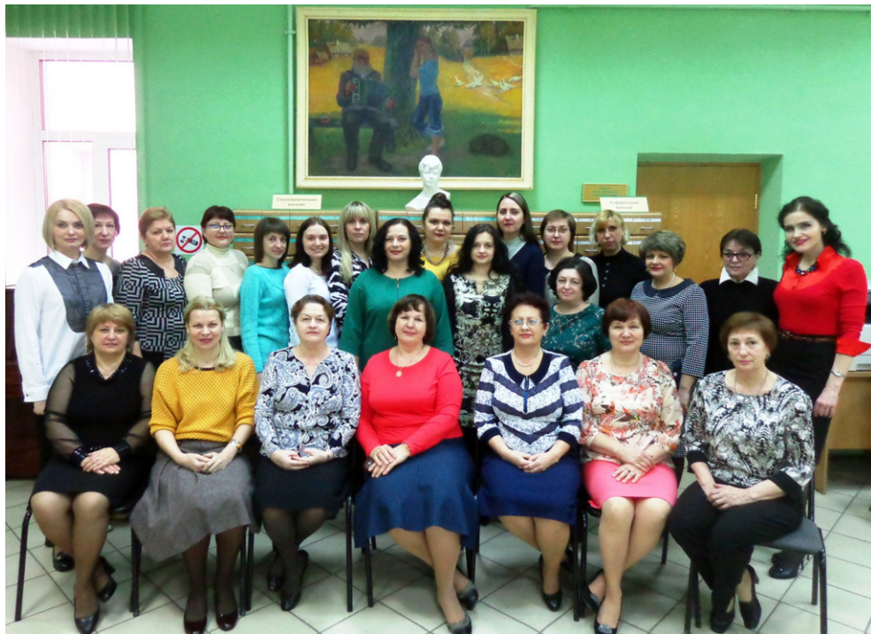
Коллектив библиотеки (2017 г.).

Своим существованием и вчера, и сегодня, и завтра: