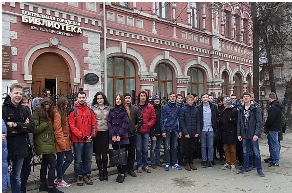
Основная группа наших читателей — молодёжь.