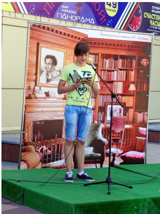
Пушкинский день России. Литературный марафон «Читаем А. С. Пушкина».

• мы подтверждаем нашу приверженность идее «Чтение — форма самостоятельной культурной деятельности всего общества»;