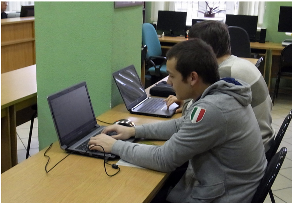
Библиотека предоставляет бесплатный доступ к wi-fi.

каталог (ЭК). Наш ЭК насчитывает порядка 47 127 записей. Актуальной стала автоматизация библиотеки. Пусть хотя и медленными темпами, но мы продвигались вперёд. В 2001 году произошло подключение к выделенной линии Интернет, в следующем — открыт Центр правовой информации. В 2004 году создан сайт Центральной городской библиотеки и официально зарегистрирован в информационно-поисковой системе. Уже в 2012 году библиотека располагала 25 персональными компьютерами. Была создана локальная сеть с выходом на все библиотеки в составе централизованной системы, во главе с Центральной городской библиотекой. Сегодня на повестке дня подключение всех библиотек централизованной системы к НЭБ РФ Центральной городской библиотеки.