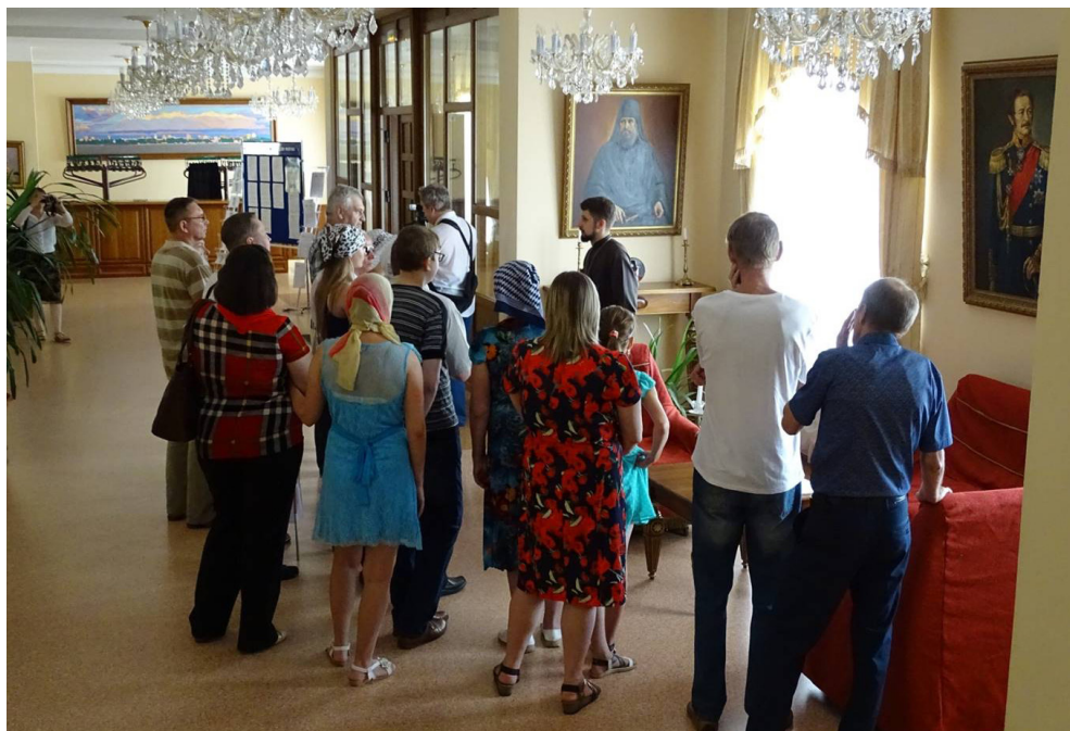
Во время лекции в Хабаровской духовной семинарии.