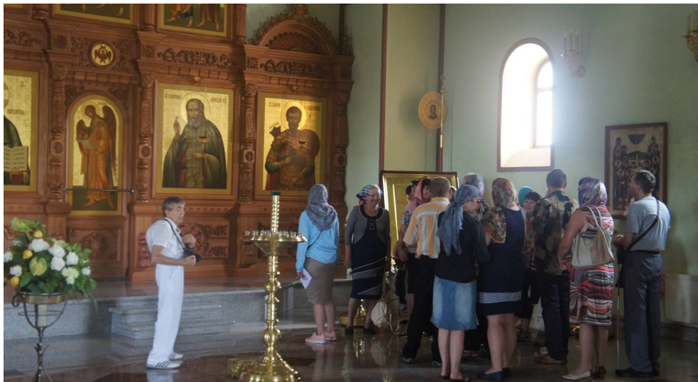
Во время паломнической экскурсии в храме Серафима Саровского.

душевный настрой, охватывающий всех, посещающих эти святые места.