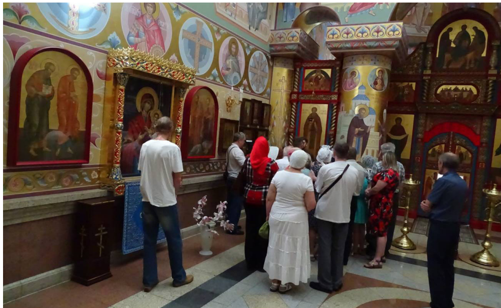
На паломнической экскурсии в домовом храме Хабаровской духовной семинарии.