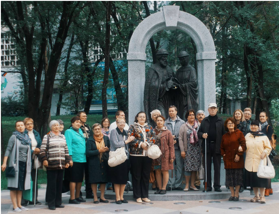
У памятника в сквере Петра и Февронии на набережной в г. Хабаровске.