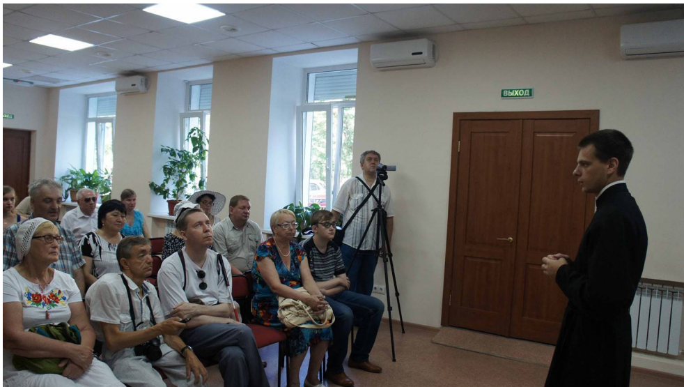
На лекции в Хабаровской краевой специализированной библиотеке для слепых.