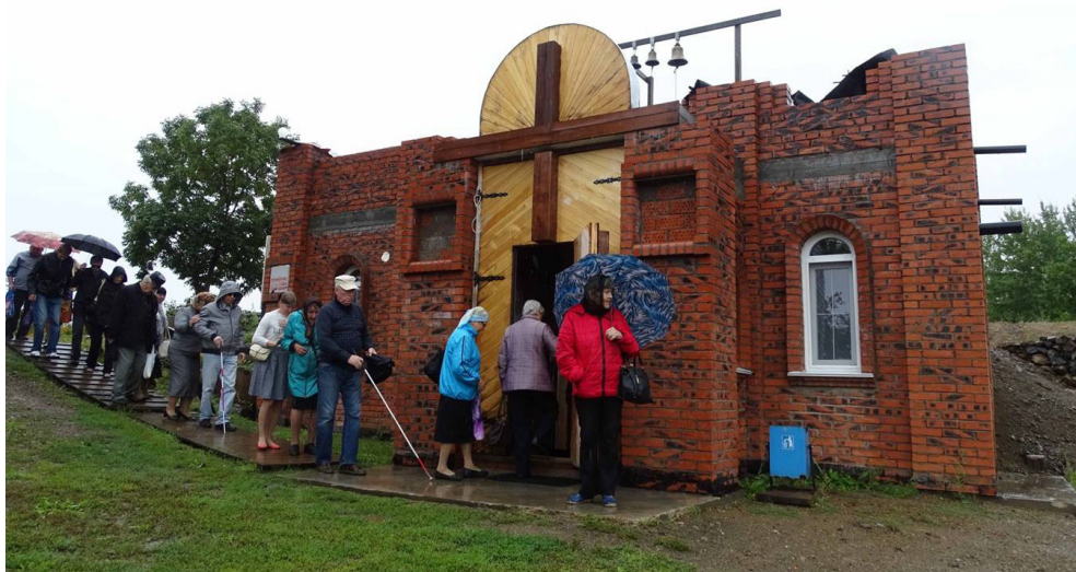
Паломническая экскурсия в Свято-Успенское архиерейское подворье (мужской монастырь) в Беловодье.