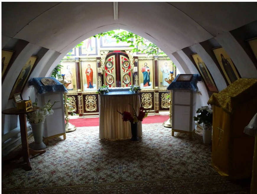
Алтарь в пещерном храме мужского монастыря.