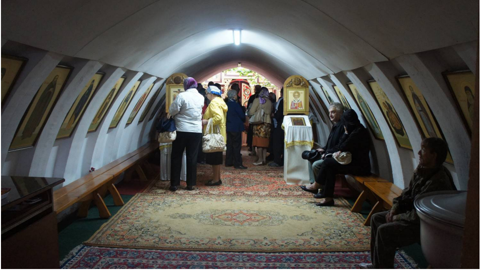
В храме мужского монастыря.