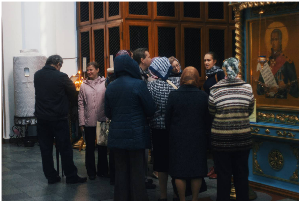
Во время паломнической экскурсии в храм святителя Иннокентия Иркутского.

В сентябре были организованы паломнические экскурсии в храм святителя Иннокентия Иркутского и Градо-Хабаровский собор Успения Божией Матери. Эти православные храмы находятся в центре города, недалеко друг от друга, и поэтому их посещение объединили в одной поездке. Инвалиды смогли стать участниками Божественной литургии, проходившей в храме святителя Иннокентия Иркутского.