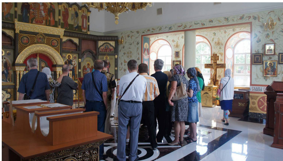
Во время паломнической экскурсии в храме монастыря.