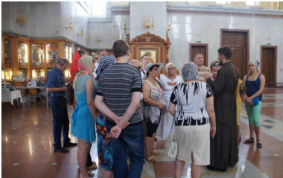
В Спасо-Преображенском соборе.

25 инвалидов, что, к сожалению, не давало возможности охватить всех желающих. В общей сложности в проекте смогли принять участие более 100 инвалидов.