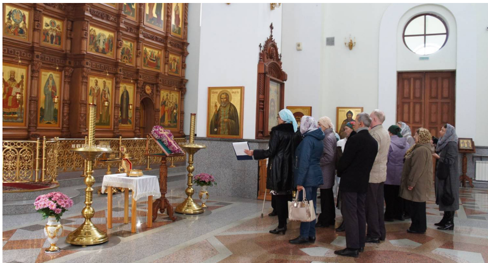
Во время паломнической экскурсии в храм святой преподобномученицы великой княгини Елисаветы.

• группа инвалидов по зрению познакомилась с историей возникновения и развития православия на Дальнем Востоке и православной веры;