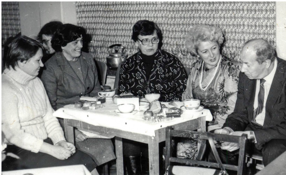
Заседание клуба, посвящённое творчеству Сергея Есенина. 11 ноября 1985 года.