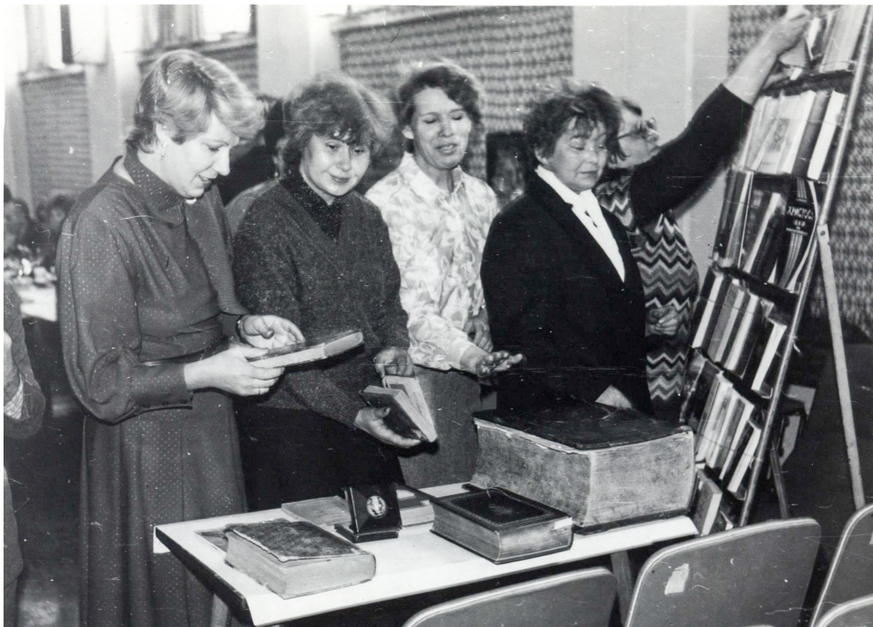
Выставка книг из фондов ДВГНБ, приуроченная к 1000-летию Крещения Руси. 1988 год.

Клуб пользовался большой популярностью среди горожан. Зимой, несмотря на холод, в актовом зале института на заседания собиралось более пятидесяти человек, и среди них были не только сотрудники учреждения, но и члены их семей и друзья. Как пелось в гимне клуба: