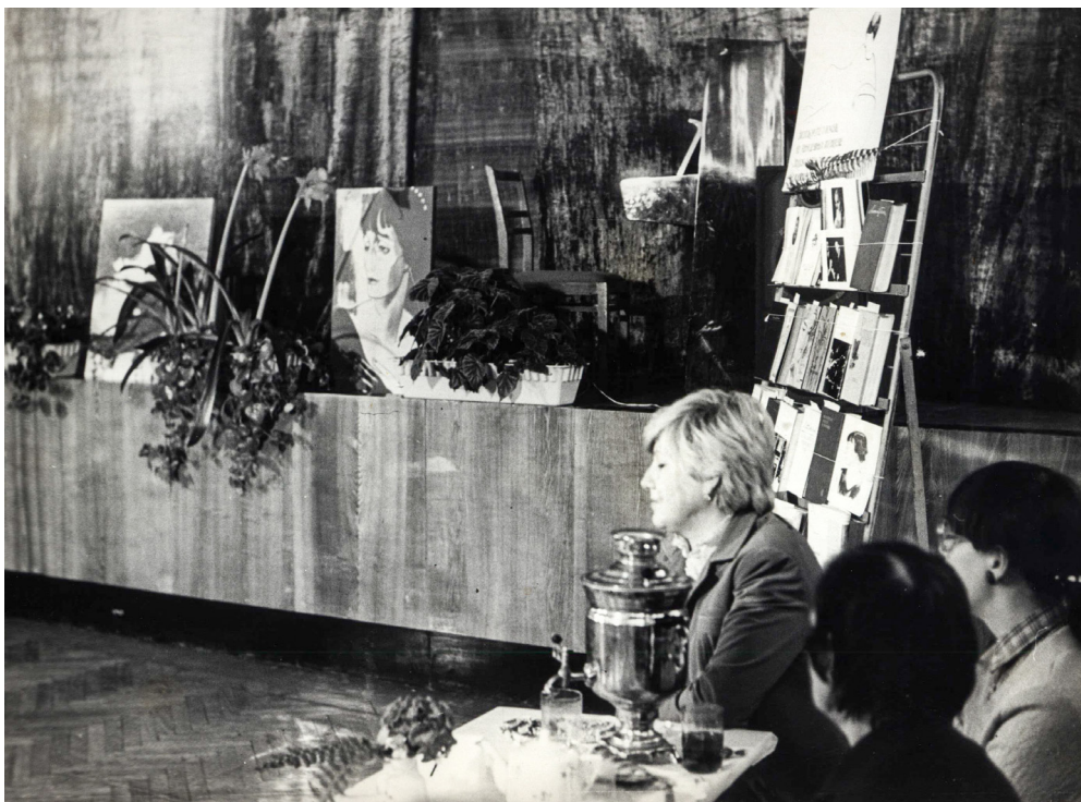
Вечер, посвящённый творчеству Анны Ахматовой.