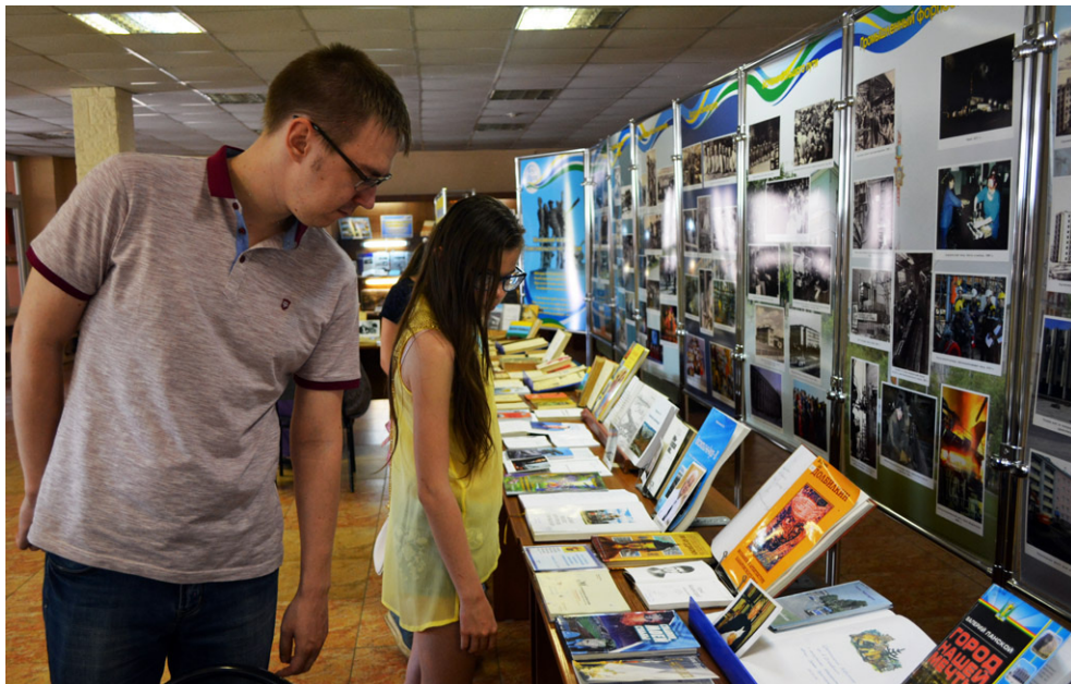
Выставка-просмотр в Центральной городской библиотеке им. Н. Островского г. Комсомольска-на-Амуре.