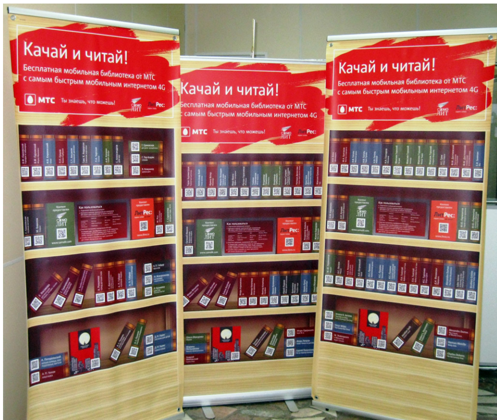
Проект «Мобильная библиотека» Межпоселенческой библиотеки Хабаровского муниципального района.

С содержательной точки зрения, работа библиотеки отличается активным внедрением новых информационных технологий, проведением районного фестиваля-конкурса видеороликов «Свой взгляд», направленного на активизацию творческого потенциала подростков и молодёжи, привлечения их интереса к истории родного города и края. В рамках программно-проектной деятельности обращает на себя внимание реализация проекта «Узоры земли Вяземской» с оформлением масштабной выставки-ярмарки декоративно-прикладного творчества земляков и организацией мастер-классов по различным видам рукоделия. Среди издательской продукции библиотеки примечателен дайджест «Преодоление» о людях с ограниченными возможностями, новых технологиях и законах для инвалидов.