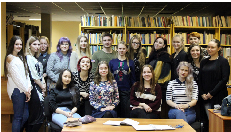
Участники проекта «МОЛОКО».