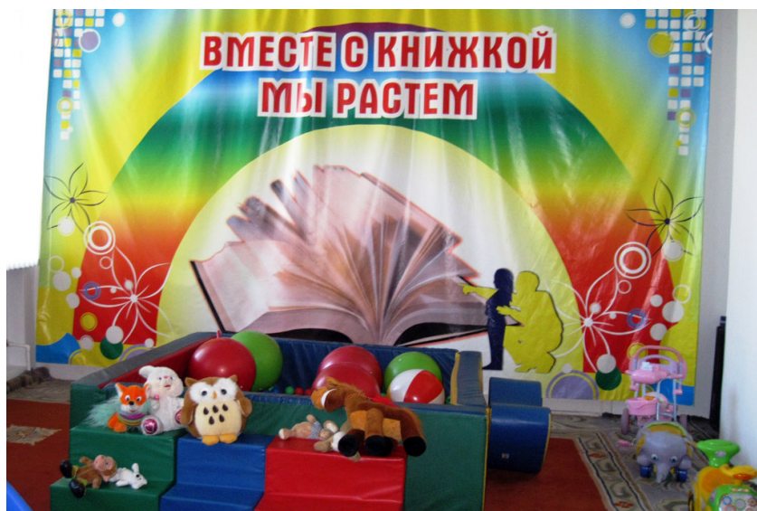
Игровая комната в Межпоселенческой библиотеке Хабаровского муниципального района.