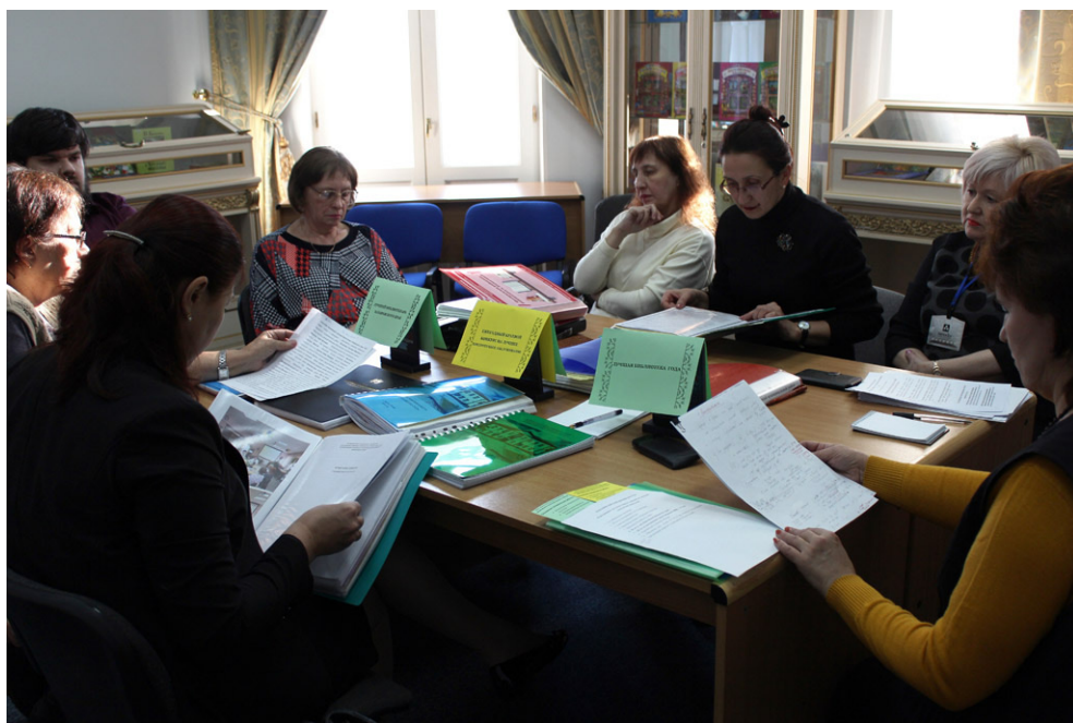
Заседание оргкомитета конкурса на базе ДВГНБ.

Присланные работы оценивались согласно обновлённому Положению о конкурсе, утверждённому постановлением правительства