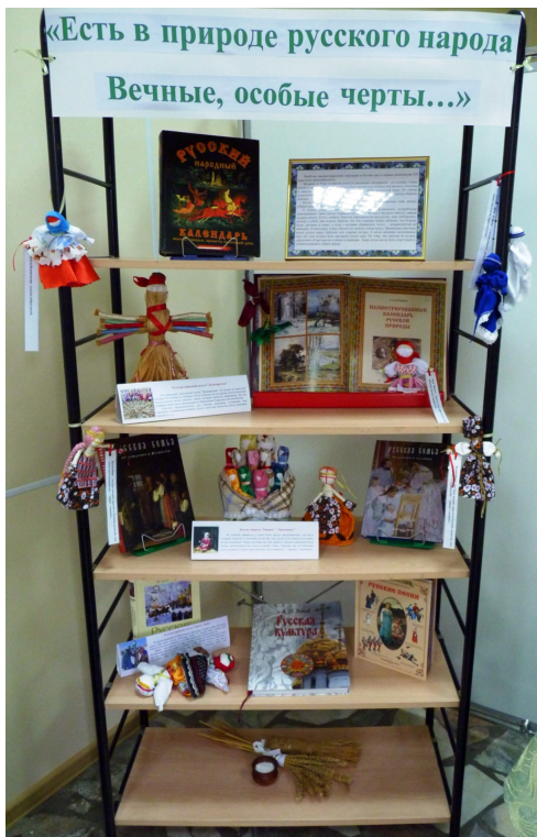
Выставка «Календарь народной куклы» в Межпоселенческой библиотеке Хабаровского муниципального района.