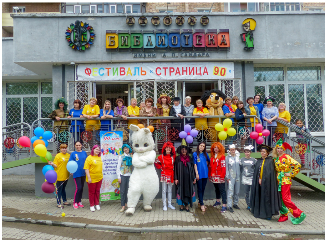
Участники фестиваля, посвящённого юбилею библиотеки.

2018 год для хабаровчан стал поистине юбилейным: в мае Хабаровск отметил свой 160-летний юбилей, а в октябре Хабаровскому краю исполнилось 80 лет!