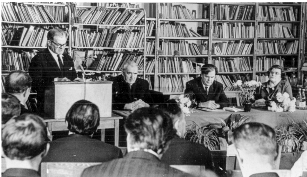
Празднование юбилея писателя в краевой научной библиотеке. 1968 год.

Личность яркая, волевая, прекрасный организатор, человек редких душевных качеств, она сумела чётко организовать работу библиотеки в