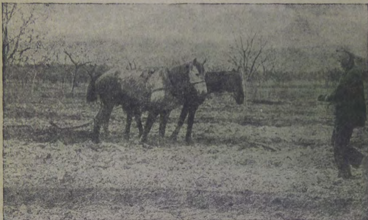
Посев в поселке

отводятся в 240 га включая закультивированную площадь. Препятствия к быстрому росту виноградников встречаются в дороговизне производства перевала, а главным образом, в ограниченном завозе из-за границы приви-