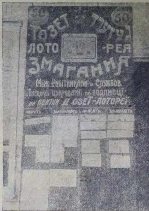
Доска соцсоревнов. по озетлотерее на Линецьком сахарном заводе

Наш корреспондент из Херсона пишет, что лотбилеты реализованы на все 100% (18.000). Много билетов распределено среди нееврейских трудящихся крестьян. Херсонская организация, в связи с лотерейной кампанией, объявила месячник Озета, поставив себе целью увеличить вдвое число членов Озета (до 5.000) усилить рабочее ядро, ликвидировать задолженность, укрепить актив и т. д. В Херсоне организован семинар на 100 чел. рабочих Озет-активистов. Результаты месячника превысили все наши ожидания, число членов