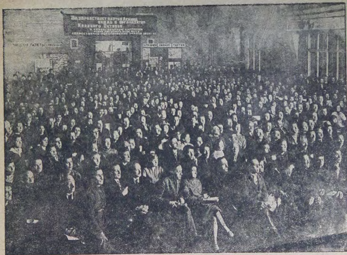
Делегаты 1 Московской конференции Озет

Все это отмечалось как в приветствиях, так и в многочисленных активных выступлениях делегатов.