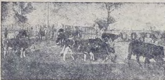
Скотный двор в колхозе Октябрь

За три года с момента организации колхозу пришлось пережить не мало трудностей.