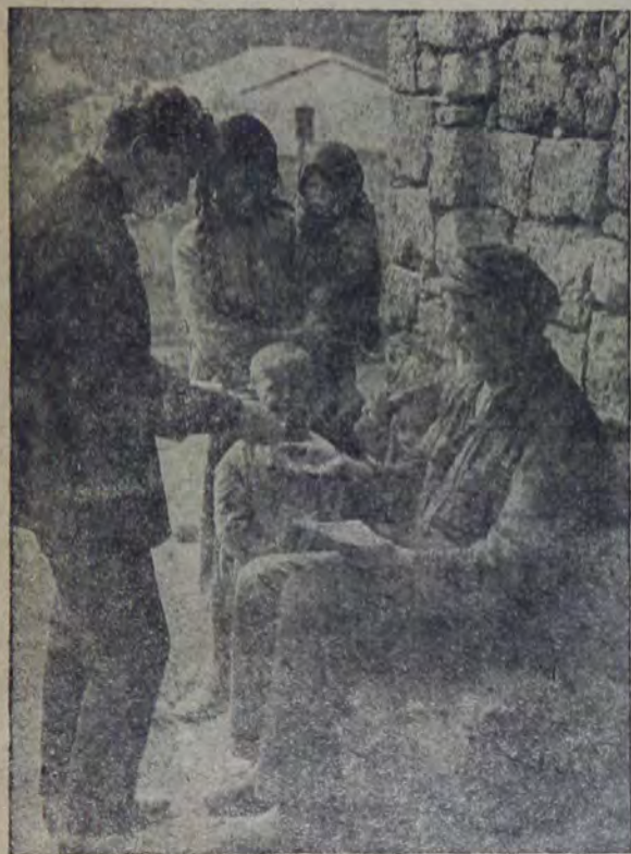
Распространение лотбилетов в поселке „Фрилинг“, Одесск. р.

25 января состоится тираж лотереи. В настоящее время наши организации заканчивают кампанию. Первые подсчеты показывают, что целый ряд крупных организаций не вы-