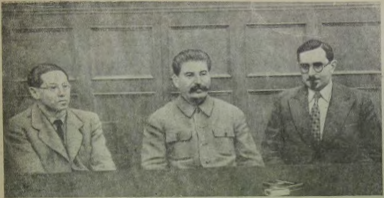
8 января товарищ Сталин принял германского писателя Лиона Фейхтвангера. На сн.: слева направо — писатель Л. Фейхтвангер, И. В. Сталин, зав. отделом печати и издательств ЦК ВКП(б) Б. М. Таль

ство Фейхтвангера и его мировоззрение находятся под влиянием двух направлений: интернациональной всемирной культуры и национальной еврейской культуры. Перец Маркиш обращается к Лиону Фейхтвангеру с просьбой изучить и осветить великое воз-