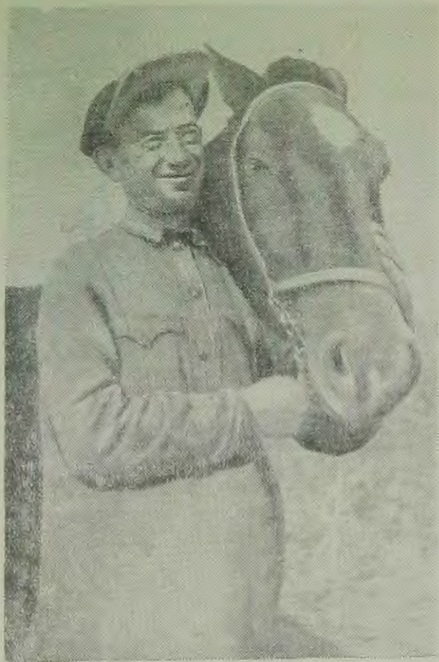
Еврейская автономная область На сн.: зам пред. колхоза им. Кагановича (с. Блюхерово) т. Мерер

Начато строительство двухэтажного дома Облрокка. В нижнем этаже будет находиться учебный комбинат: медицинских сестер, санитарных дружин, кружков ГСО и т. д.