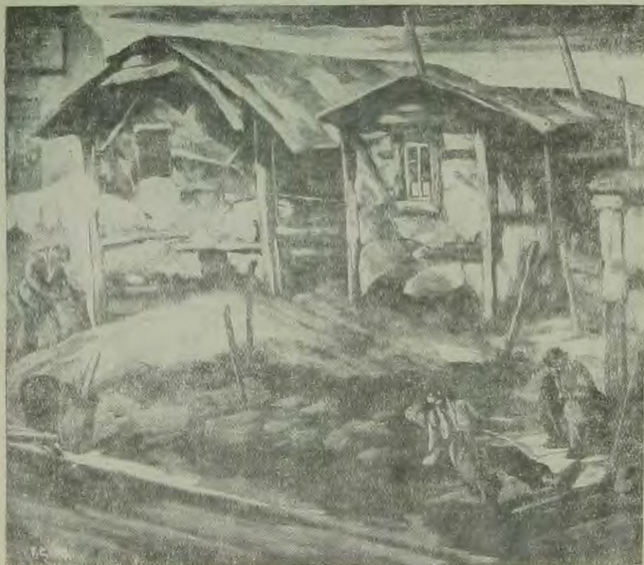
В стране „пресперитти“. Репродукция с картины американского художника Кирк

Представленные на выставке скульптура и графика стоят на более высоком уровне, чем живопись.