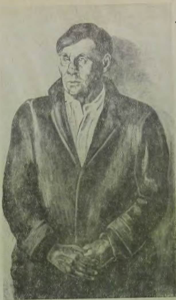
Безработный. Репродукция с картины американской художницы Д. Гелерман

Весьма характерный, хотя и красочно сдержанный портрет бездомного человека работы Дианы Гелерман знакомит нас с этой многообещающей художницей, дарование которой не успело расцвести. Она умерла от удара полицейской резиновой дубинки во время рабочей демонстрации 1935 г., в которой принимала участие. Заслуживают внимания портрет негрятки работы Эдмонда Арчера и чарующая по своей красочности, по нюансированному серому тону картина Соль Вильсона: «Погрузка мрамора» (масло). Но застыв-