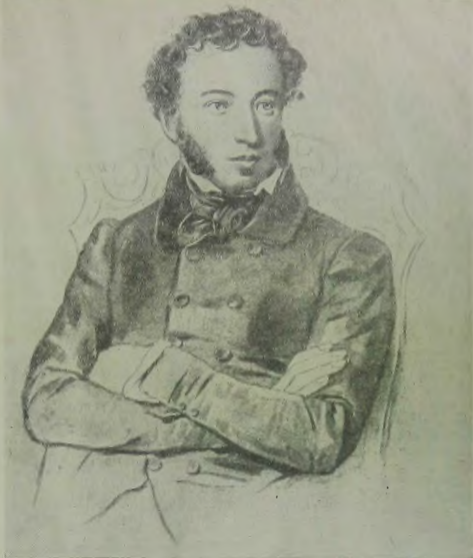
Александр Сергеевич Пушкин Репродукция с картины художника Соколова

кровищниц замечательной литературы великого русского народа. Национальная культура и литература, родной язык преследовались, были лишены необходимых элементарных условий развития и роста. Лишь на практике ленинско-сталинской национальной политики народы Советского Союза впервые познали русскую литературу, как братскую литературу, оплодотворяющую их собственные национальные по форме и социалистические по содержанию культуры.