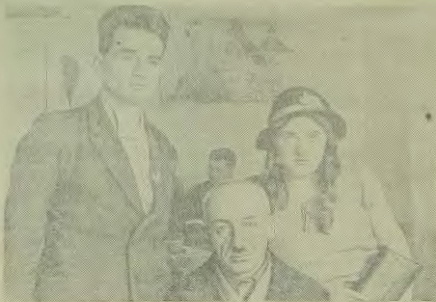
Группа делегатов колхоза им. Свердлова, Тельменского района, Крым АССР, на 4-м Всекрымском съезде колхозников стахановцев