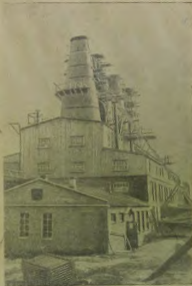
Еврейская автономная область На сн.: новый извастковый завод в Лондоно

нович по телеграфу потребовал от директора Биробиджанского совхоза т. Дубнова обеспечить Сталинский техникум топливом на зиму. Тов. Дубнов забыл о распоряжении Наркома. Дровами техникум не обеспечен, в учебных помещениях и в общежитиях студентов холодно.