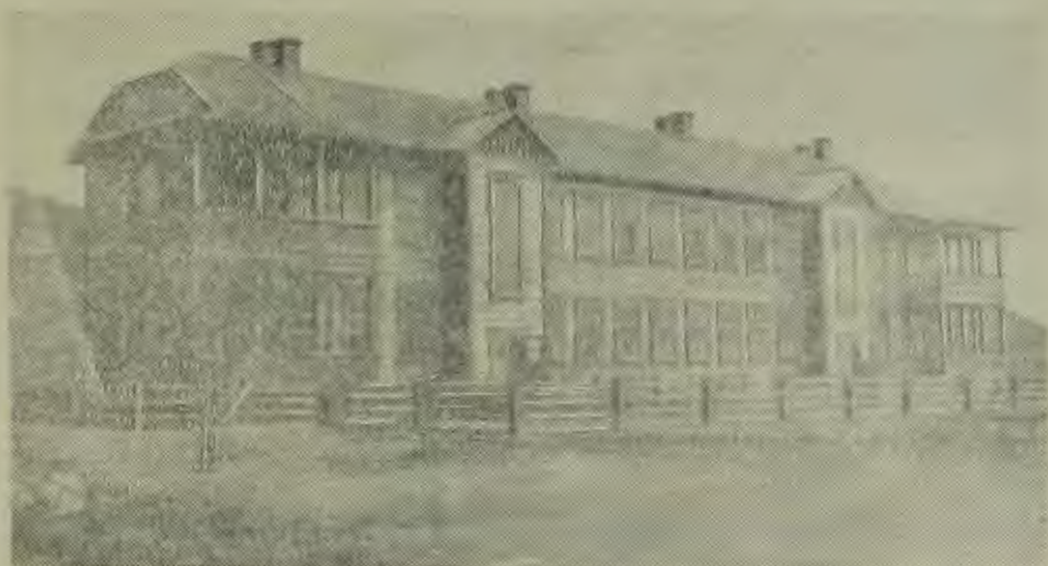
Еврейская автономная область На сн.: неполная средняя школа в Биранане

— Словами нельзя передать тот восторг и ликование, которые мы вместе с делегатами Съезда испытывали, когда по радио слушали доклад отца нашего, дорогого Сталина. Что может сравниться с радостью женщины, получившей в Стране Советов все права? Известна женская доля в старое время в России и положение ее в капиталистических странах по настоящий день. В Литве падо мною, работницей, издевались на каждом шагу, платили втрое, вчетверо меньше, чем мужчине. «Ты женщина», — говорили мне хозяева в ответ на жалобы. Это слово звучит позором в капиталистическом мире. У нас в СССР женщина — равноправный, полноценный член общества. Нигде и никогда так не заботились о матерях и детях, как у нас. Вот почему сердца наши переполнены огромным счастьем и