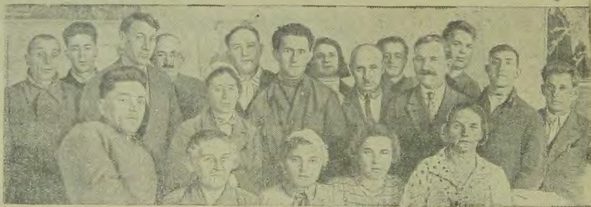
Группа делегатов 4-го Всекрымского съезда колхозников-стахановцев с членами президиума Крымозета