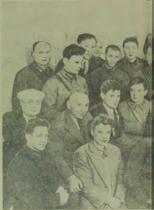
Группа евреев — красных командиров редакции газет

Руководители Еврейской автономной области часто бывают у нас в казармах и, чем могут, помогают нам. Уже одно появление руководителей Еврейской области в казармах вызывает среди красноармейцев большой энту-