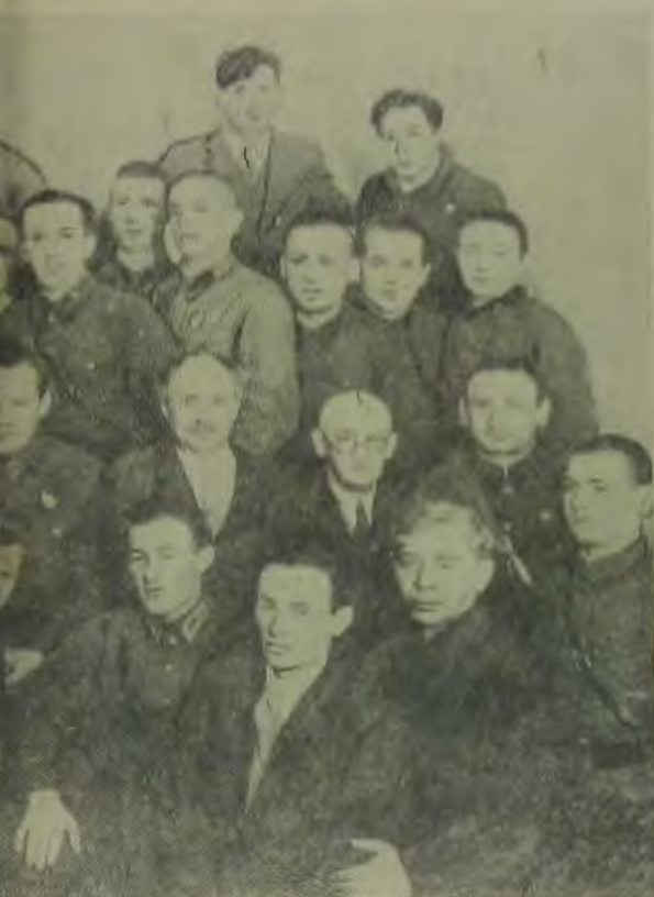
ейскими писателями и работниками „Дер Эмес“