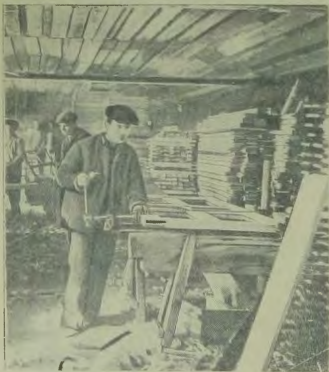
Еврейская автономная область На сн.: цех строительных деталей фабрики „Деталь“

Тугоплавкость (графит плавится только при 4 000 градусах), хорошая электропроводность и эластичность графита дают возможность применять его в различных отраслях промышленности.