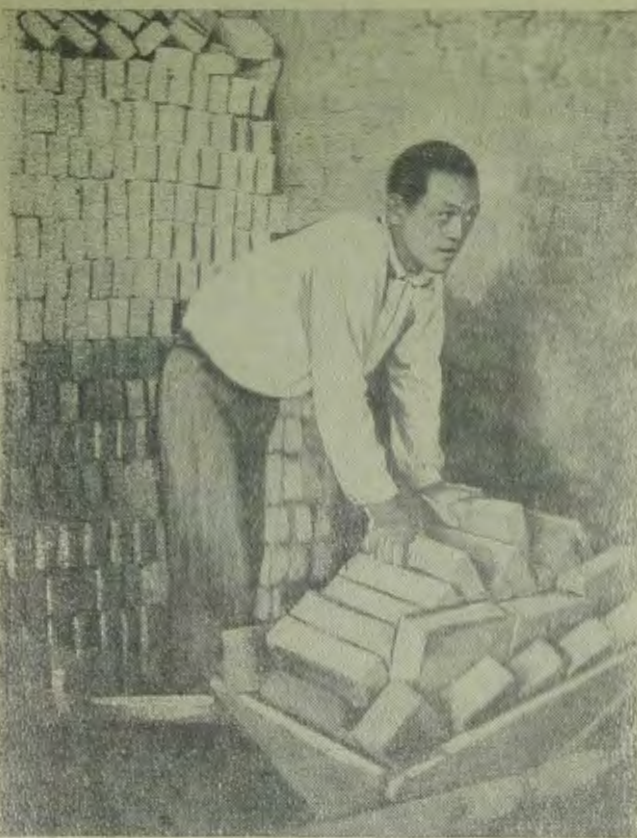
Еврейская автономная область

У нас слишком развился бюрократизм. Мы неоднократно получали сигналы: «посмотрите, где массовые организа-