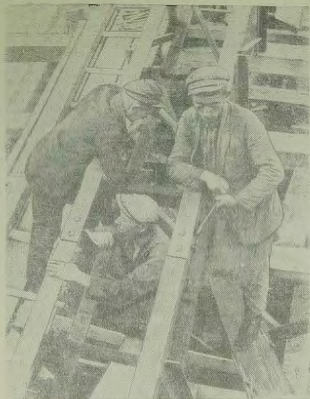
Еврейская автономная область На сн: стахановская бригада монтажников за сбором одной из конструкций на Лондоковском известном заводе