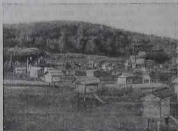
Пасека в хуторе Добринском.

Таковы положительные перспективы, которые вырисовываются в отношении Б.-Б. района. Одновременно нельзя закрывать глаза на трудности, с которыми связана его колонизация.