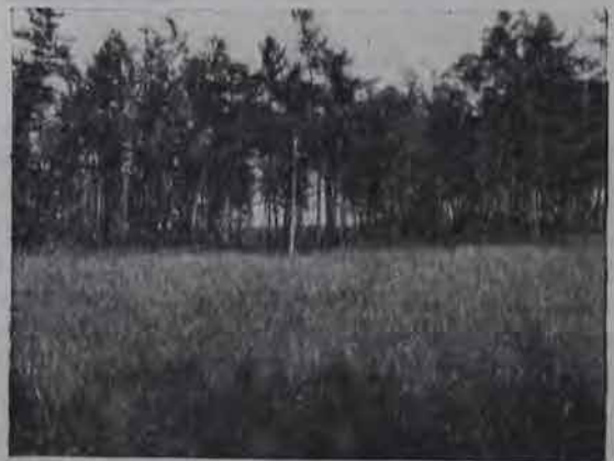
У реки Козулихи.

По своему экономическому положению район тяготеет к тихоокеанским портам, куда ведет жел. дор. магистраль, пересекающая район на севере, от Хабаровска до ст. Облучье на протяжении 320 километров, и одна из величайших водных магистралей в мире — р. Амур, окаймляющая район с запада и с юга на 720 верст.