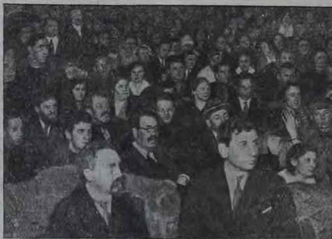
Общий вид митинга