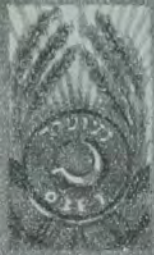
די אידן פון ארבעט און אף ערד.