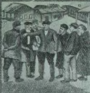
די אידן פון ארבעט און אף ערד.