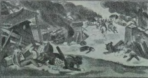
די אידן פון פוילן, און אירע אידן פון ארבעט און אף ערד.