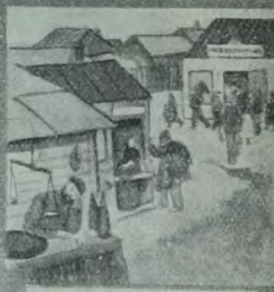
די אידן פון ארבעט און אף ערד.