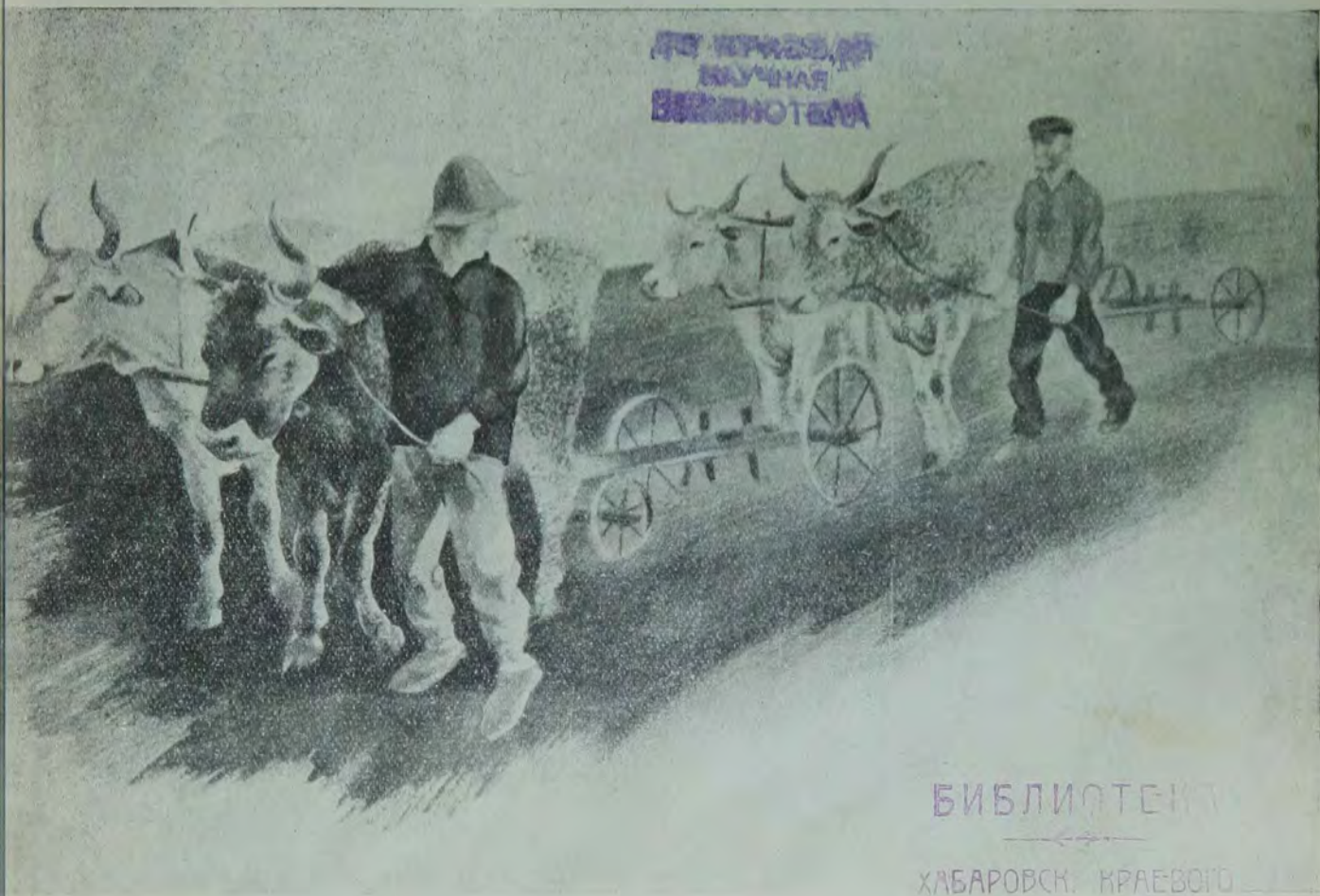
Рисунок художника Н. АЛЬТМАНА