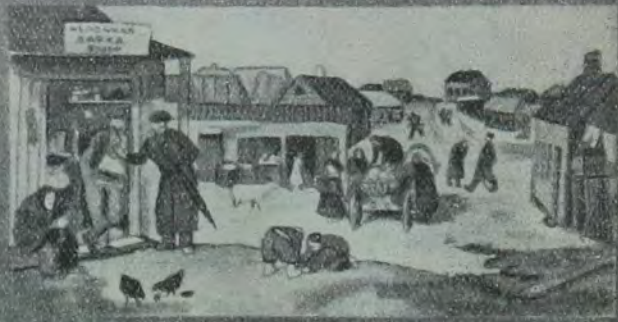
די אידן פון ארבעט און אף ערד.