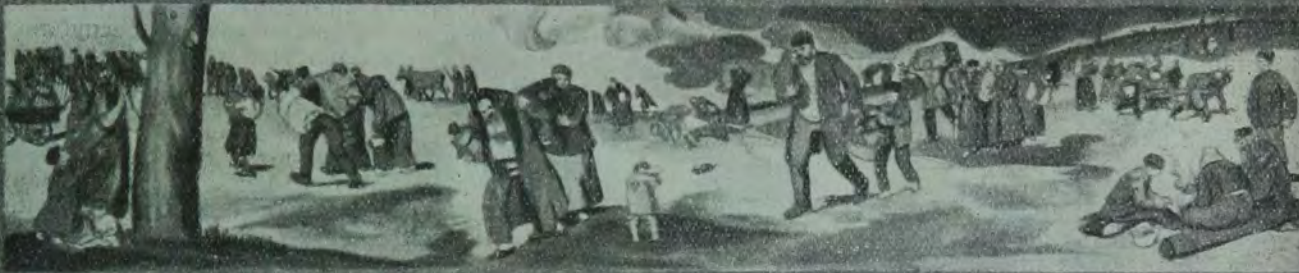
די אידן פון ארבעט און אף ערד.