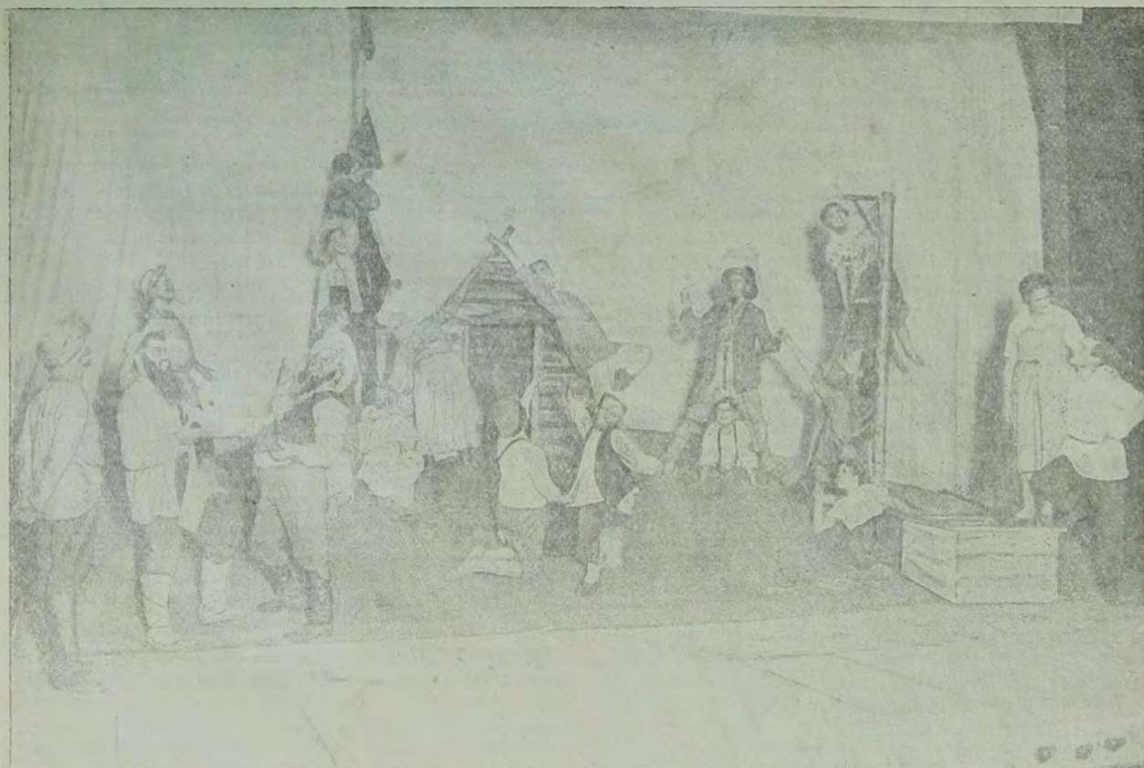
Сцена из второго акта.