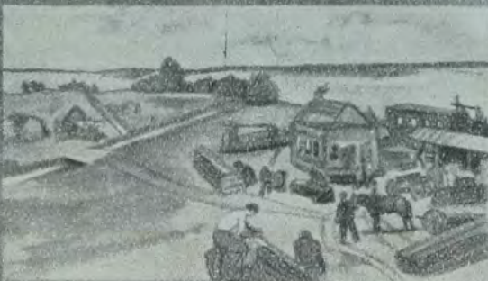
די אידן פון ארבעט און אף ערד.