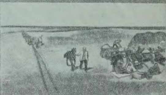
די אידן פון ארבעט און אף ערד.