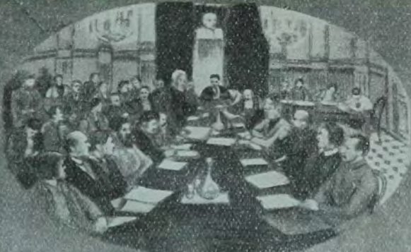
די אידן פון ארבעט און אף ערד.