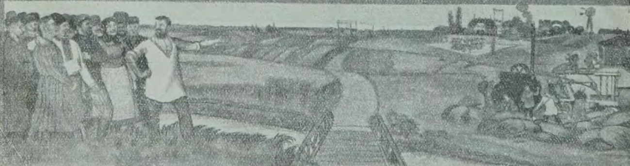
די אידן פון ארבעט און אף ערד.