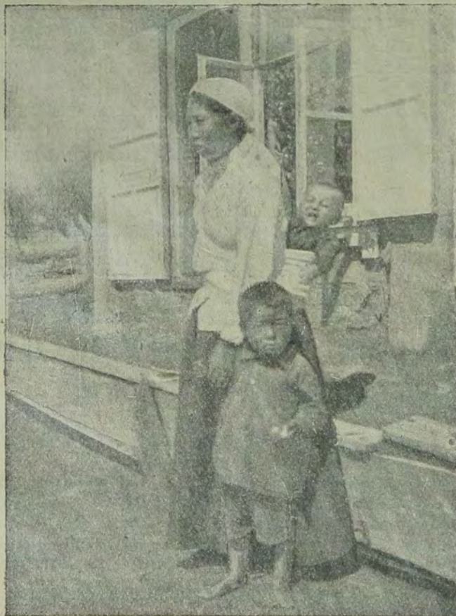
Женщина корейка с детьми (Биро-Биджан)

Но те же блестящие организационные перспективы накладывают на руководителей всей предстоящей организации и ответственную обязанность предварительной глубокой принципиальной ее проработки.