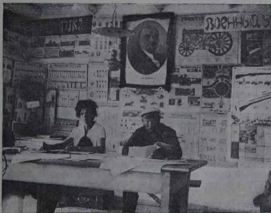
Изда-читальня на 63-м участке „Найбройт“ (Евпаторийс. район в Крыму).

Особый интерес представляет положение еврейских трудовых масс, которые в течение десятков лет были загнаны в местечки Белоруссии, и насильственно были лишены возможности жить нормальной экономической жизнью. Общими усилиями государства, в особенности благодаря неусыпной забот-