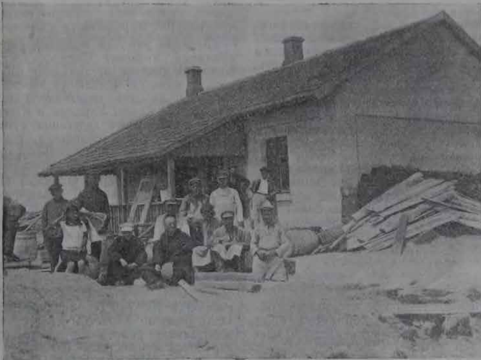
Сыроварня, построенная ЦП Озет в поселке Фрайдорф Евпаторийского района в Крыму.

Об активной работе сообщают также Воронеж, Баку, Нижний-Новгород, Пенза, Смоленск, Брянск и Ленинград.