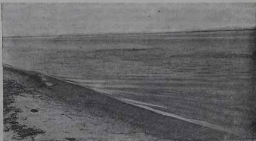
Река Амур у Михайло-Семеновского.

Мы отдаем себе отчет, что кое-где на наши местные организации делается сильный нажим со стороны кандидатов на переселение, но все же мы считаем себя в праве ожидать и требовать, чтобы наши организации чувствовали бы ответственность за дело в целом и не пускались бы