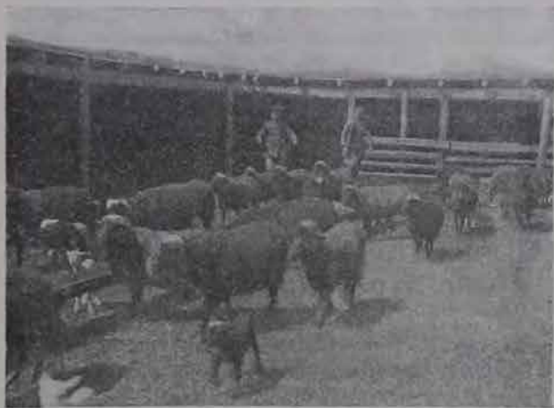
Кошара для овец в евр. колониях в Крыму.