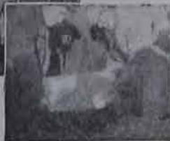
Митинг при закладке «Дома Озета».