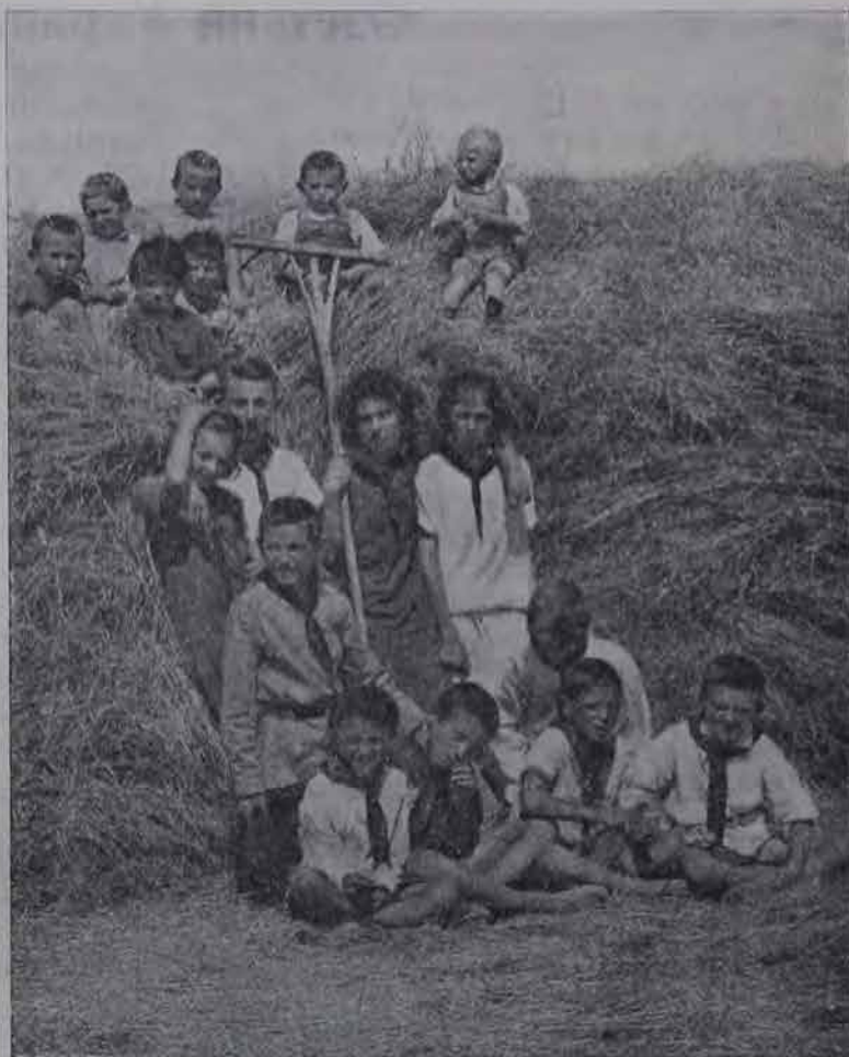
Пионеры в еврейской колонии в Крыму.

Перед Озетом на Украине стоит задача дальнейшего оформления своей работы, в первую очередь, среди рабочих и других слоев трудящегося населения на Украине, дальнейшей популяризации задач Озета, на основах полного интернационализма. Озет должен взять на себя задачу подготовки кадров земледельцев для колонизации отведенного советской