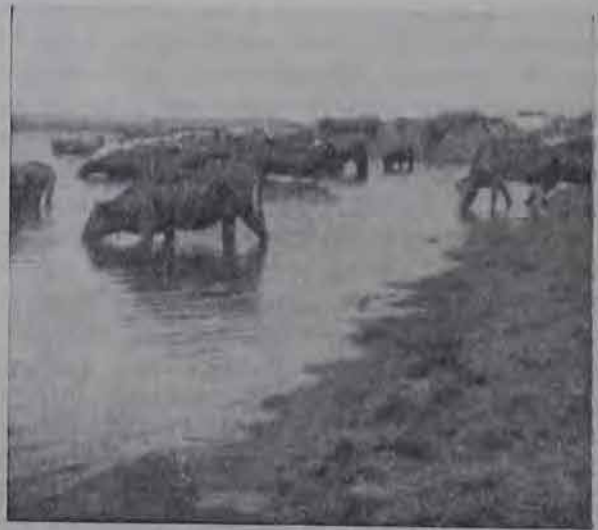
На водопое (Херсонщина).

Эти конференции дадут возможность развития самокритики в озетовских рядах.