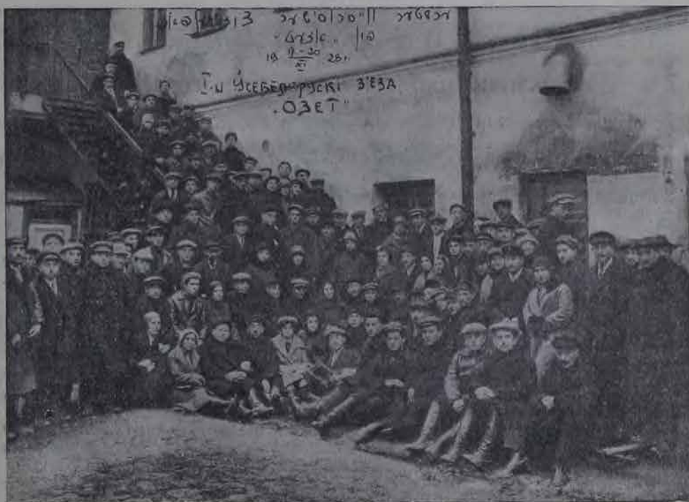
Первый Всебелорусский Съезд Озета.