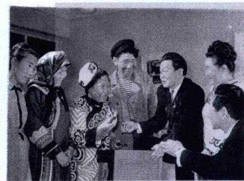
Встреча с найхинцами