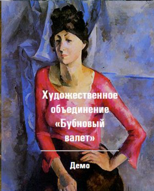
Художественное объединение «Бубновый валет»