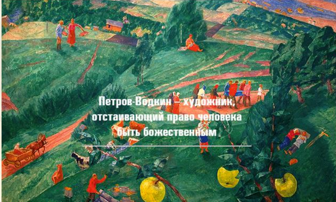
Петров-Водкин — художник, отстаивающий право человека быть божественным