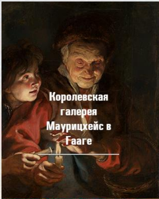
Королевская галерея Маурицхейс в Гааге