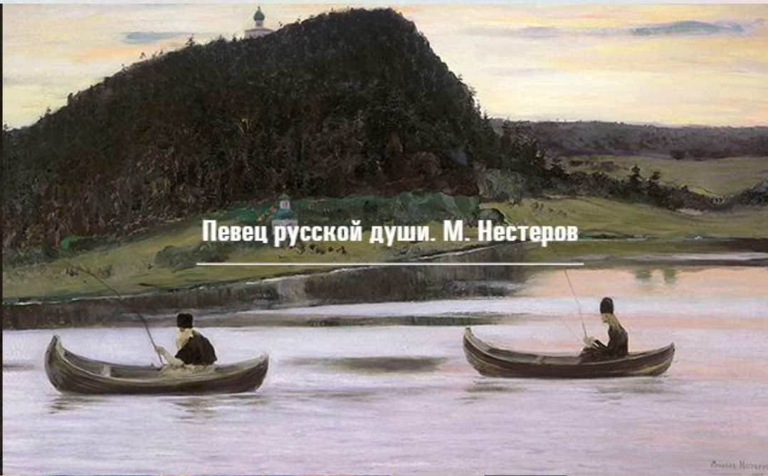
Певец русской души. М. Нестеров