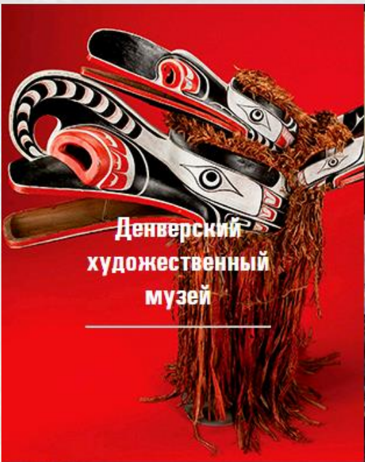
Денверский художественный музей