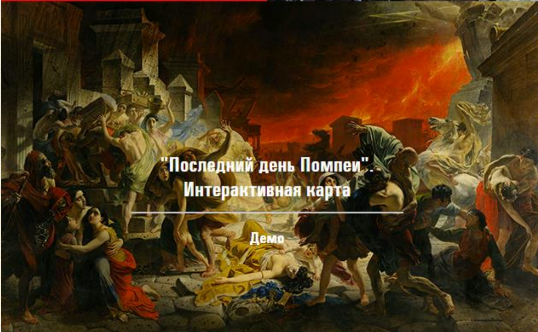
"Последний день Помпеи" Интерактивная карта