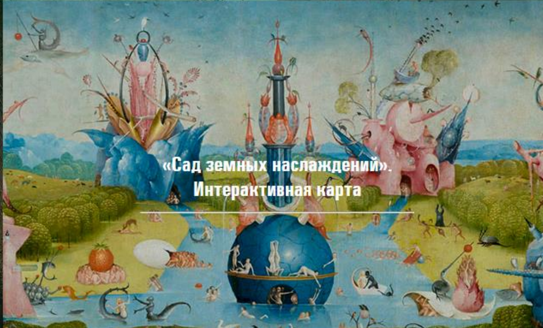
«Сад земных наслаждений». Интерактивная карта

Доступ к выпускам Артотеки осуществляется по подписке на Арт-Портал «Мировая художественная культура», которая дает возможность не только читать публикации в онлайн журнале, но и откроет доступ ко всем разделам и проектам сайта.