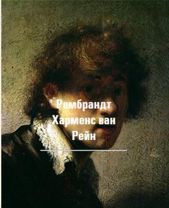
Рембрандт Харменс ван Рейн