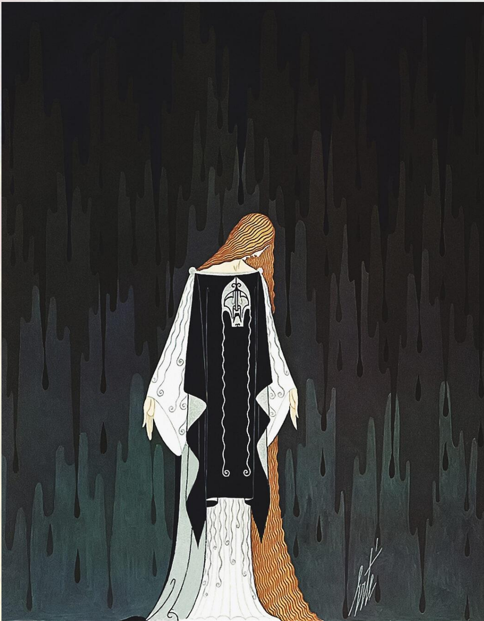
Костюм для Лукреции Бори (1927)

Художник моды — одно из самых удивительных направлений в прикладном искусстве.