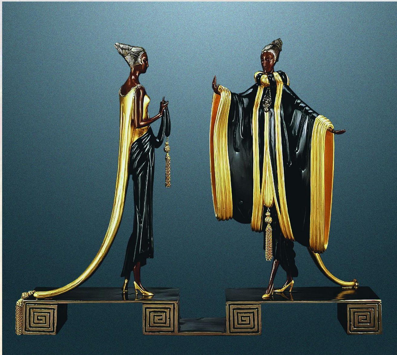
К балу готовы (1989)

Эрте поработал в Голливуде, затем ушел из кино, но все равно продолжал создавать костюмы для американских звезд сцены: Лиллиан Гиш, Ирен Бордони. Они выступали на Бродвее в невероятных платьях Эрте и ни у кого из актрис больше ничего подобного не было.