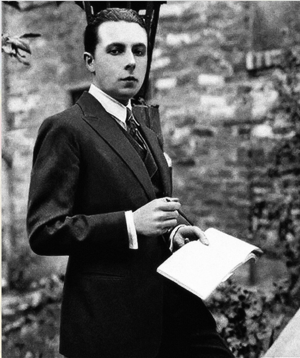
Эрте (Роман Петрович Тыртов)

Роман Петрович Тыртов родился в 1892 году в столице Российской империи, в старинной дворянской семье. Романа с детства увлекала живопись, театр и дизайн одежды. Он с интересом рисовал, в том числе образы платьев для своей матери.