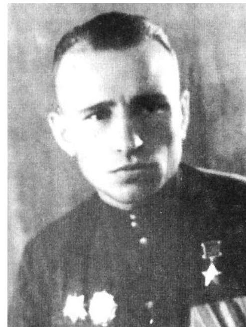
Сентябрь 1920 г. 100 лет со дня рождения Валентина Викторовича Пилипаса (1920–1957)