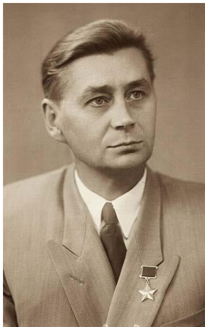
7 января 1920 г. 100 лет со дня рождения Ивана Васильевича Котова (1920–2000)