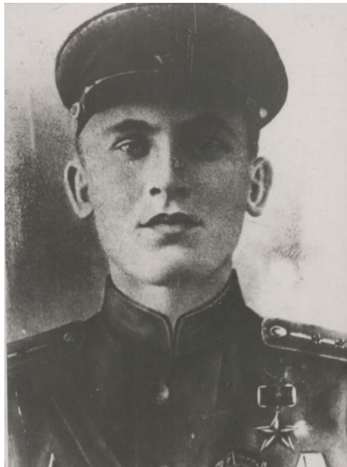
18 августа 1920 г. 100 лет со дня рождения Андрея Антоновича Бельгина (1920–1943)