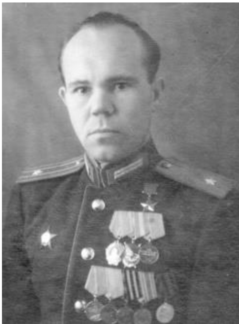
15 сентября 1915 г. 105 лет со дня рождения Харлама Акимовича Русских (1915–1975)