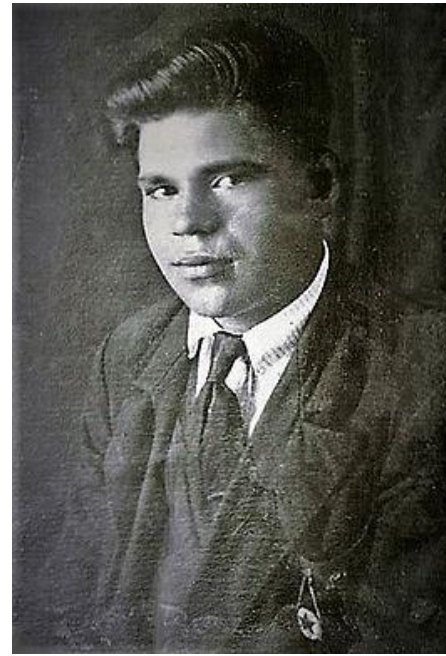
100 лет со дня рождения Николая Даниловича Грищенко (1920–1943)