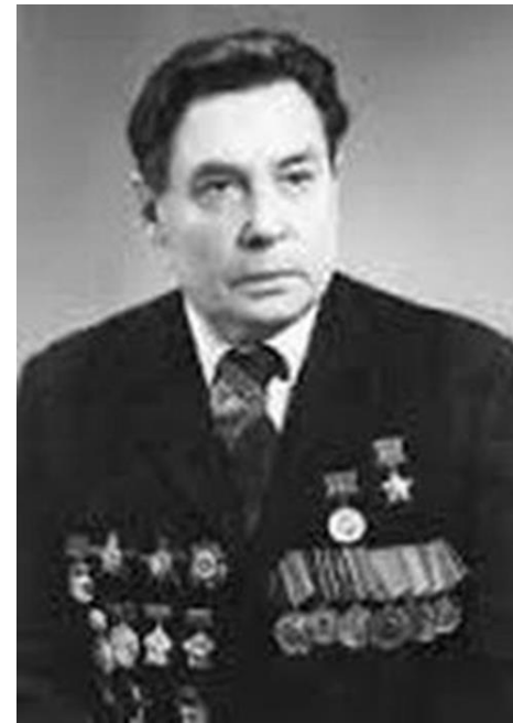
1 января 1920 г. 100 лет со дня рождения Евгения Александровича Клюшникова (1920–1989)