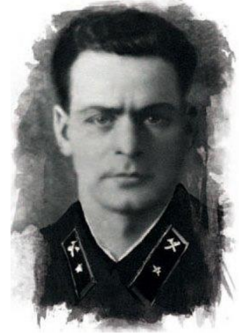
7 января 1910 г. 110 лет со дня рождения Константина Сергеевича Заслонова (1910–1942)