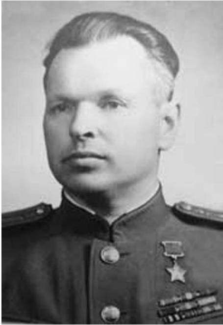
6 января 1905 г. 115 лет со дня рождения Георгия Григорьевича Тарасова (1905–1973)