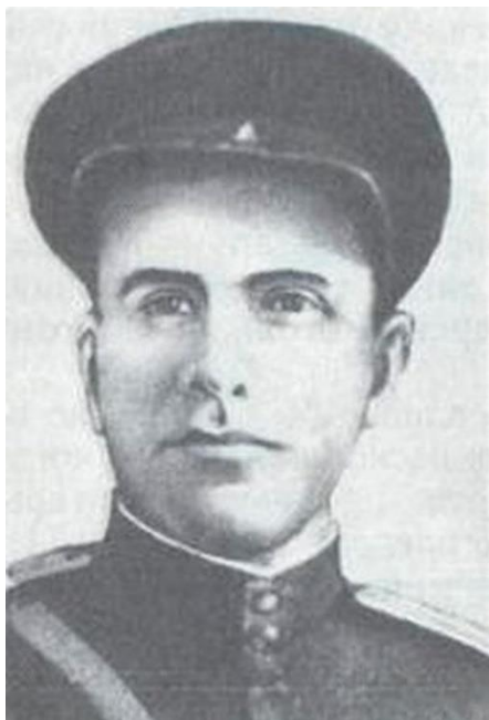
30 августа 1910 г. 110 лет со дня рождения Георгия Герасимовича Бондаря (1910–1945)